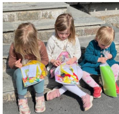
Utdeling av påskeposer

Etter gudstjenesten på palmesøndag delte vi ut påskeposer med en liten påskebok, hobbymateriell, godteri og ark med oppgaver. Det var også en påskeløype rundt menighetshuset.