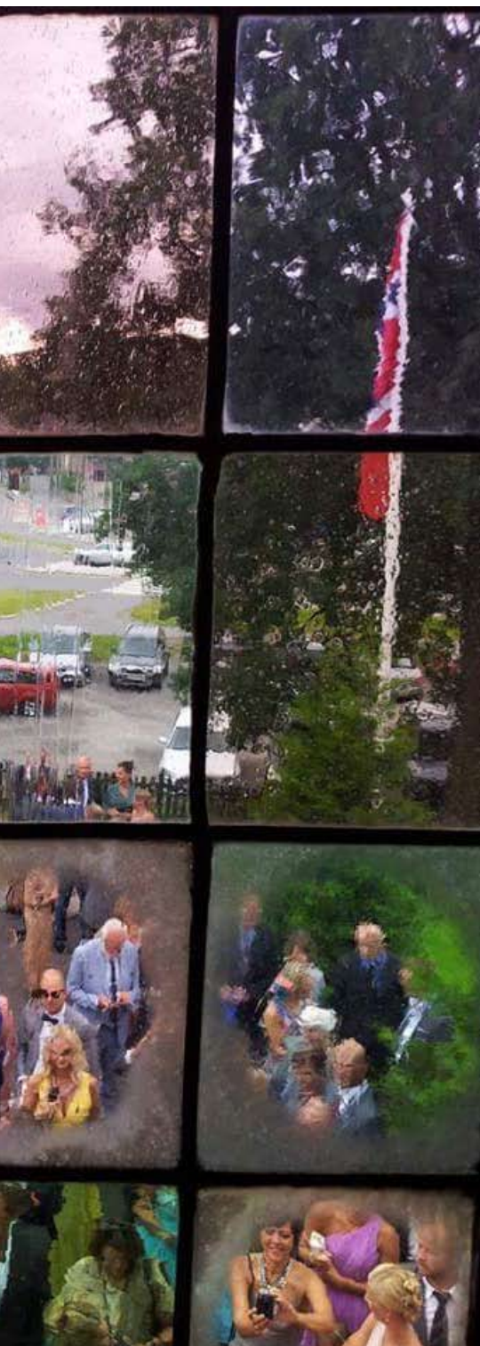
Beige