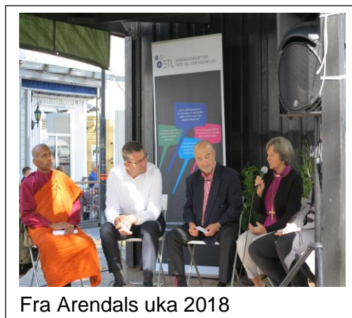
Fra Arendals uka 2018

I år 2022 hadde vi et pilotprosjekt. Med en klasse fra ungdomsskole trinnet på Steinerskolen, som gjennomførte en dialog dag med besøk i Moske og Kirken/Arene. Se egen omtale i årsrapporten.