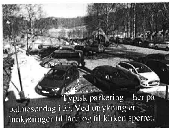
Typisk parkering – her på palmesøndag i år. Ved utrykning er innkjøring til låna og til kirken sperret.