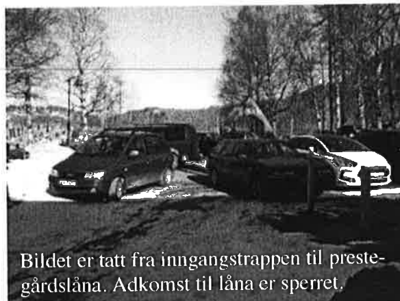
Bildet er tatt fra inngangstrappen til prestegårdslåna. Adkomst til låna er sperret.