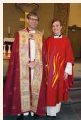
Ordinanten sammen med biskop Stein Reinertsen.