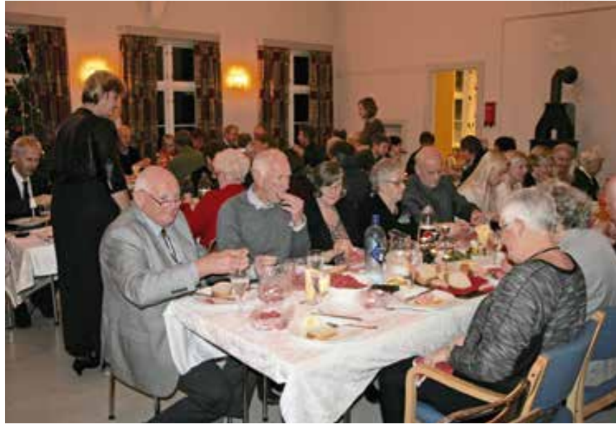
God stemning i lokalet når det innbys til voksen juletreffest på Toftenes bedehus.

Hva er det egentlig som skjer på den sagnomsuste juletreffesten på Toftenes bedehus? Kan jeg gå der, jeg som ikke har et gram tilhørighet dit? Er det virkelig så gøy som alle skal ha det til?