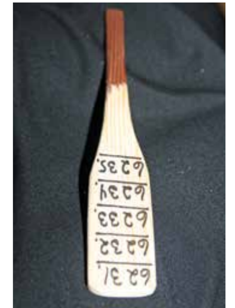
Åresalg med ordentlige årer.

Jeg skrøt av organiseringsevnen til komiteen i stad, men akkurat trekning er kanskje ikke deres beste side. De solgte nemlig årer med så høye nummer at trekkeprogrammet ikke klarte å trekke så høyt. Forsamlingen måtte legge til 5600 på hvert tall for å få riktig nummer. Komplisert? Ja, noe, men vi kom oss igjennom. Og jeg ble imponert over årene, de så ut som, ja, årer. Slike man ror