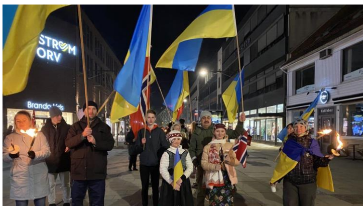
Fredsmarsj for ukrainske flyktninger i mars 2023 – i Storgata på vei til Lillestrøm kirke.

I løpet av året har vi hatt en rekke ad-hoc samarbeid med ulike aktører. I mars 2023 var vi blant annet med å arrangere fredsmarsj i samarbeid med Rælingen menighet og ukrainske flyktninger på Nedre Romerike. Lillestrøm menighet har også spilt en sentral rolle i arbeidet med å få etablert Dialogforum for Nedre Romerike (formelt stiftet på nyåret 2024). Menigheten har videre et godt samarbeid med NITJA museum for samtidskunst ifm en årlig temakveld rundt 1. mai. Denne faste temakvelden fokuserer på ulike former for solidaritet i vår tid – her i Lillestrøm.