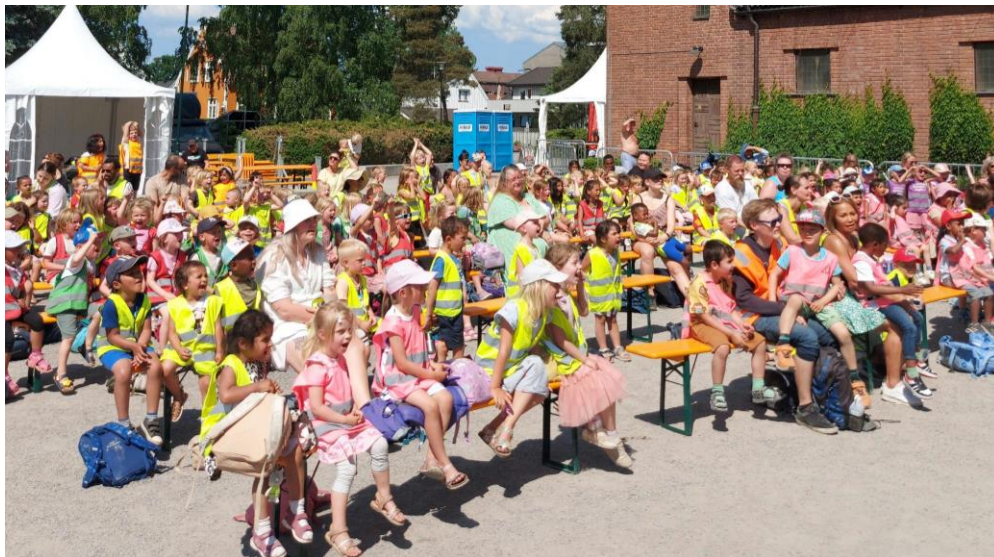
Fra Byfesten i juni 2023. Barnehagene er på besøk på Solplassen.

Vi har også lyst til å utvide allsangkonseptet i samarbeid med nye grupper i byen, f. eks Lillestrøm kommune og seksjon for aktivitet (Stillverksveien Ressurscenter). Norasonde kan også være en interessant samarbeidspartner.