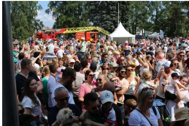
(Bjørnisdansen fra scenen utenfor kirken under byfesten i juni med et kjempestort publikum)