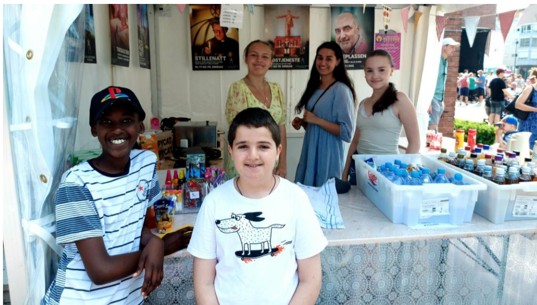
Frivillige på Byfesten i Lillestrøm.

Det totale antall frivillige i Lillestrøm menighet var i 2023 180 unike personer, mot 171 i 2022, og 219 i 2019. Vi ligger fortsatt noe bak frivilligheten slik den var før pandemien. Vi har som ambisjon å arrangere jevnlig medarbeidersamlinger. Det å være frivillig i Lillestrøm menighet skal være trygt, berikende – og helt overkommelig.