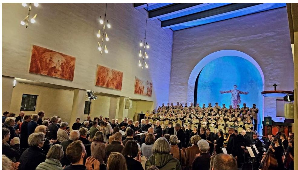
Fra oppføringen av oratoriet Elias under Kirkemusikkfestivalen i oktober 2023.

Dette sier noe om at Lillestrøm kirke når bredt ut, og en sentral aktør i kulturlivet. I 2022 var Lillestrøm kirke faktisk den største kulturkirken i Borg bispedømme (vurdert ut fra besøkstall på konserter og kulturelle arrangement). Vi kjenner ikke tallene fra alle de øvrige Borg-menighetene i 2023, men vi vet at egen aktivitet har vokst sammenlignet med fjoråret. Kirkemusikkfestivalen som ble gjennomført i oktober var en særlig stor satsning. Vi håper at denne over tid – i samarbeid med Lillestrøm kirkelige fellestråd, kan videreutvikle seg til en tradisjon. Kanskje annethvert år er et realistisk? I 2024 er det ikke ressurser til å gjennomføre en ny festival.