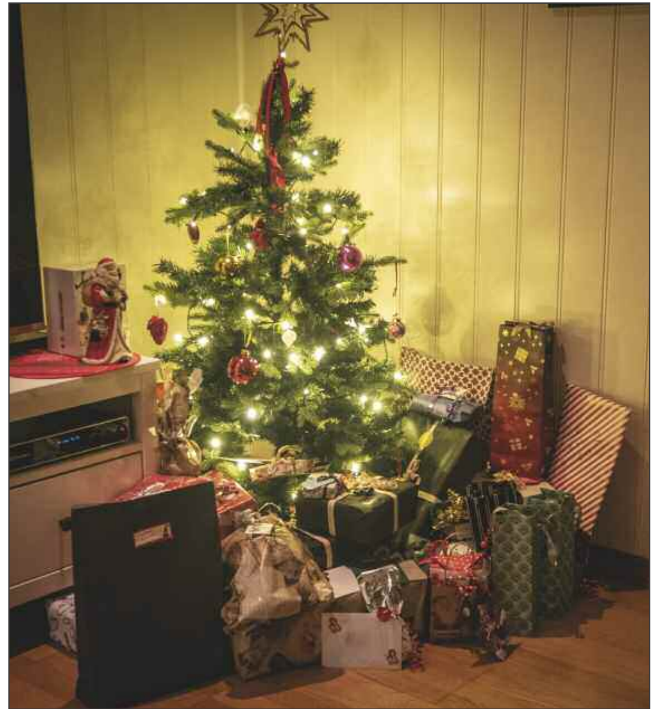
Få høytider er mer tradisjonsrike enn jula. Det gjelder både nyere og eldre tradisjoner

Noe som også jeg husker fra min egen barndomsjul, som vi riktignok ikke praktiserte, men som blei prata om, var at resten av maten fra måltidet julekvelden skulle stå framme til neste dag. Den skulle være til de underjordiske og usynlige julegestene. Nils Lid skriver at i Fet vart det brukt å ha maten stående framme til nyårsdagen, og at ingen måtte spise opp maten en fikk på julekvelden.