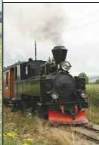
Terittent (nr. 24)

I mars i år ble Astrid Finneide ansatt som reiselivs-utvikler i prosjektet. I tillegg til at hun vil arbeide for å hjelpe alle besøks- og opplevelsesstedene i «Tømmerruta», skal hun også arbeide for å markedsføre tilbudene, slik at vi blir kjent med stedene vi kan besøke.