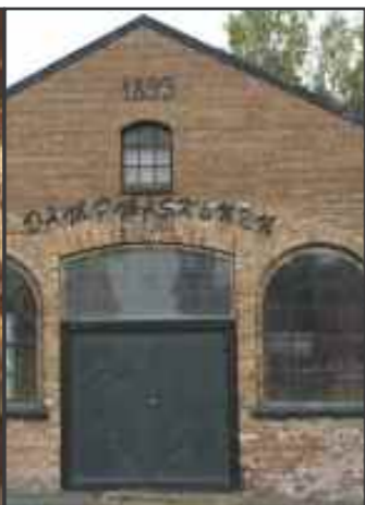
Dampmaskinhuset (nr. 8)