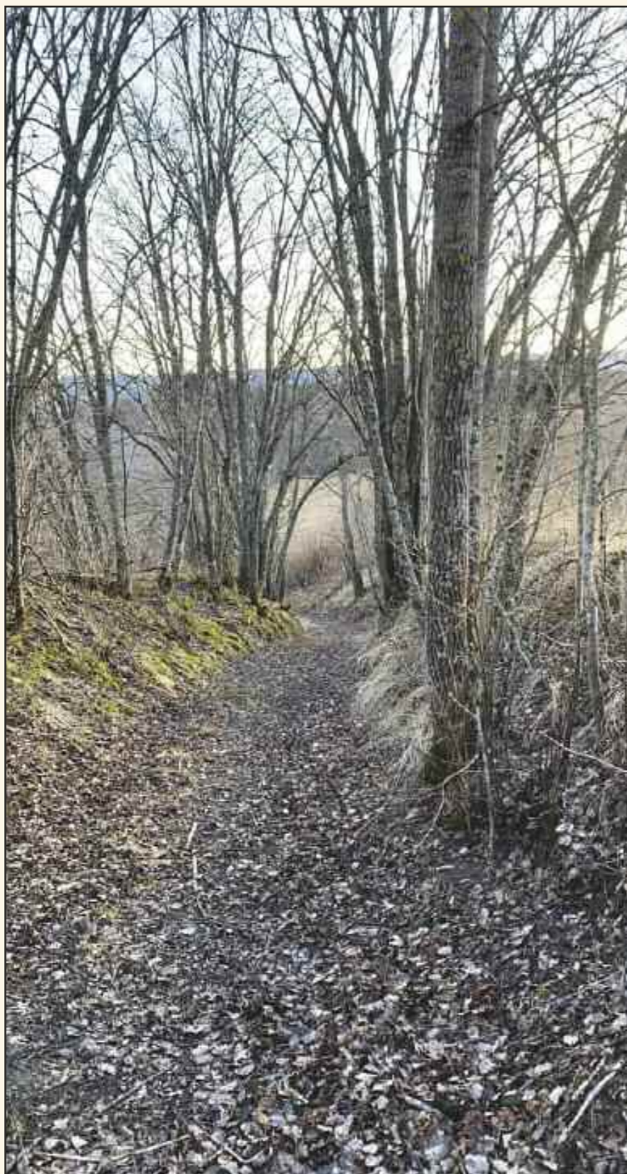
Østengbakken, i april 2020