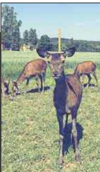
Hjorteparken (nr. 20)