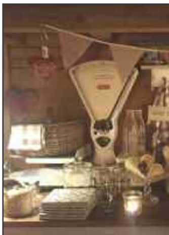
Bestefar Huset (nr. 18)