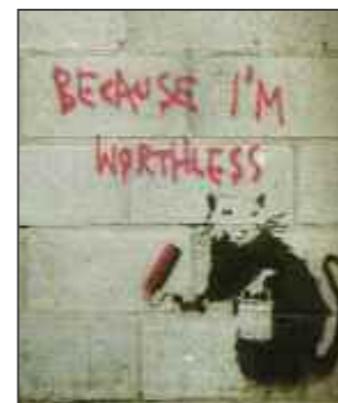
Banksy: because i'm worthless

Konserten er åpningsarrangementet for en utstilling som viser arbeidet til 15 ungdommer fra Fetsund, som gjennom fire verksteder har utforsket hva gatekunst kan være. Verkstedene er ledet av Oslo Street Art, som jobber for å bygge en bro mellom gatekunst- og graffiti-subkulturer og den øvrige allmennheten.