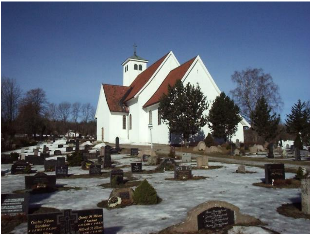
Lier prostesete opprettet i 1999.