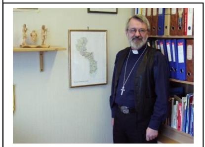
Prost Steinar Solbakken