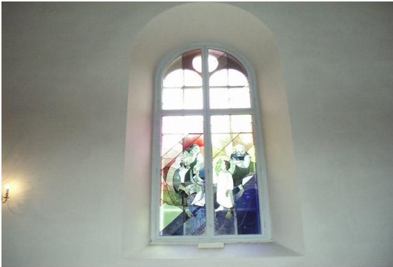
Ett av de nye glassmaleriene i Tranby kirke

er ferdige. Kunsthåndverker Rigmor Bove har laget skissene i samarbeid med Kirkelige kulturverksted. Tranby menighet har i sin helhet stått for kostnadene takket være en testamentarisk gave. I tillegg har menighetsrådet bidratt med kr 46 000.- Sum kr 266 000.-