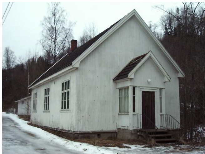
Tronstad bedehus : 2000-02-28

Siste gudstjeneste på Tronstad bedehus var søndag den 13. mai 1999.