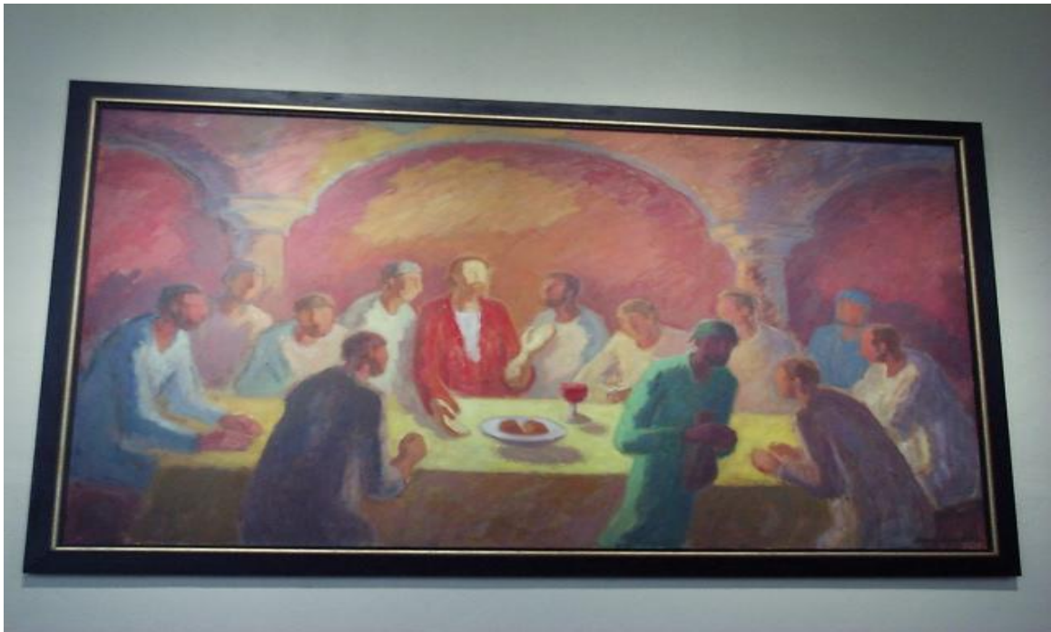
Sissel Vagard: Nattverden

Sjåstad kirke har i løpet av fjoråret fått et nytt vakkert maleri i kirken. Det forestiller nattverden som er malt av kunstneren Sissel Vagard. Det er Sjåstad menighetsråd som har stått for bestillingen. Dette var en del av den kommunale gaven til Sjåstad menighet i forbindelse med kirkens 100 års jubileum i 1996. Pris kr 56 500.-