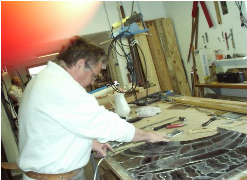
Reparasjon av det midtre glassmaleriet i korbuen

Det er også påvist at innrammingen mellom bly og glass kunne vært bedre tilpasset. Det er noe av forklaringen til at glassmaleriene kan miste noe av fasongen etter en del år. I tillegg er det nødvendig med ventilering gjennom glassmaleriene og hovedglasset, for at ikke mellomrommet skal bli for overopphetet. Dette kan også skape trykkvirkninger som kan få glassmalerien til å så bue på seg. I mai i fjor ble det midtre glassmaleriet bak alteret tatt ned av firmaet Svelvik kunstglass. Det var ferdig restaurert i slutten av mai måned og var montert tilbake i kirken i god tid før konfirmasjonen.