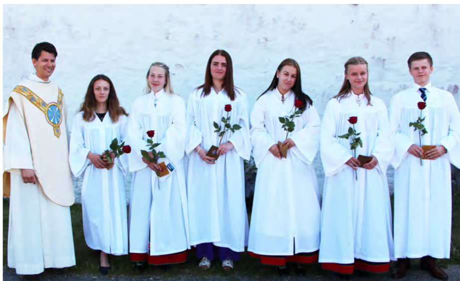
Konfirmanter søndag 27. mai