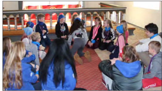
Avisleken er alltid gøy!