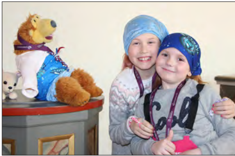
Gode venner på tårnagenthelg.

På de ulike postene var ungdom fra ledertreningsopplegget og kirkens ansatte.