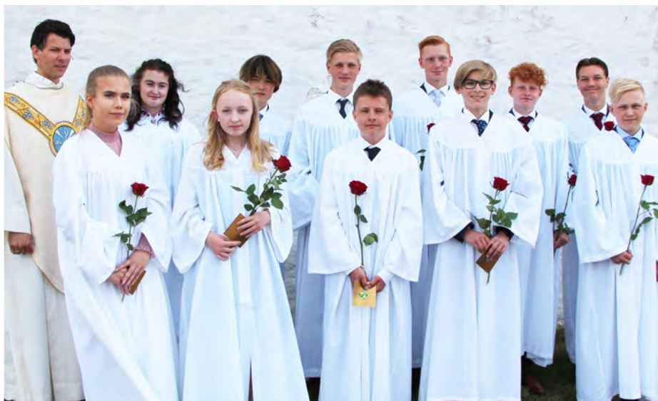
Konfirmanter lørdag 26. mai