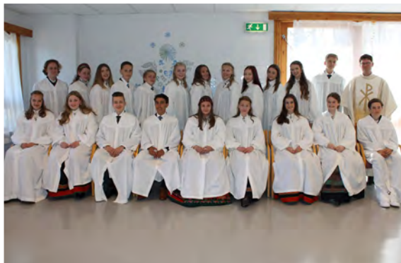
Konfirmanter lørdag kl. 13.00