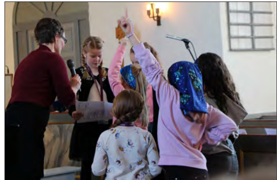
Under gudstjenesten på søndag var det nye oppdrag som måtte løses, og tårnagentene klarte det med glans!