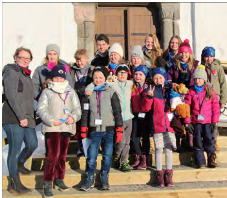
Flotte tårnagenter i Tjølling menighet. Det ble en super helg!