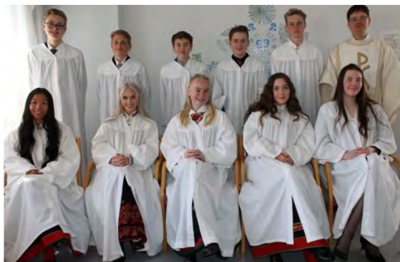
Konfirmanter søndag kl. 11.00

I år ble 50 ungdommer konfirmert i Østre Halsen kirke. Det har vært en flott gjeng å samarbeide med. Konfirmanterne har alltid stilt opp, og de har fylt kirken med liv og glede gjennom konfirmasjonstiden.