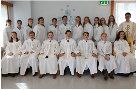
Konfirmanter lørdag kl. 11.00