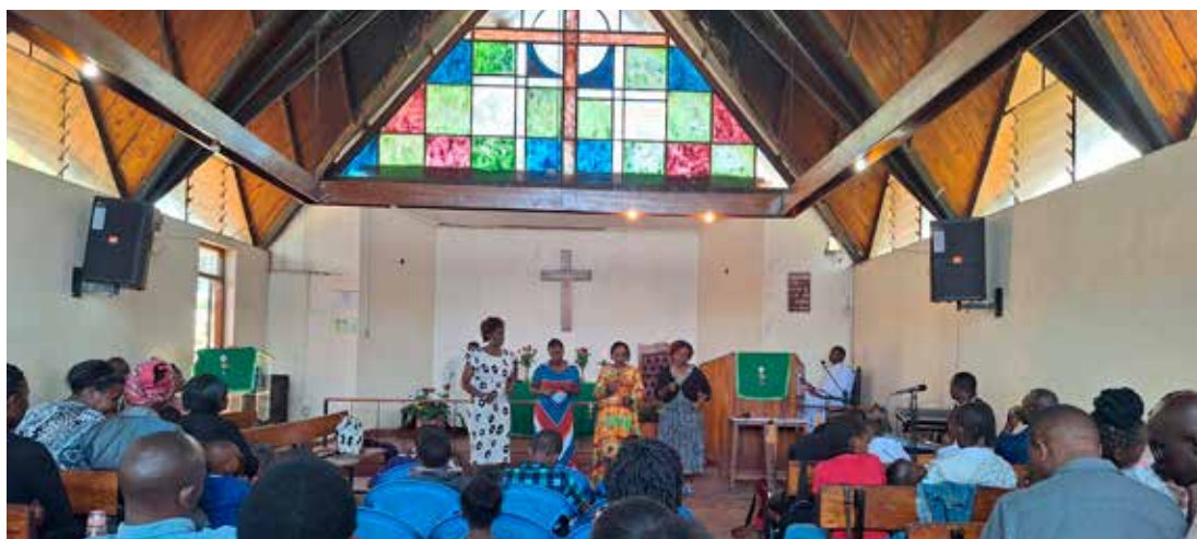
Ein lokal kyrkjelyd i Nairobi, Kenya

- Det er det, men i sjølve arbeidet vil eg nok kjenne meg trygg og på heimebane. Som regional leiar skal eg ha kontakt med dei lokale kyrkjene som misjonen har samarbeidd med i 75 år. Den evangeliske kyrkja i Etiopia, Mekane Yesus, er faktisk den største lutherske kyrkja i verda med over 11 millionar medlemmer av eit folketal på 130 millionar. Samarbeidskyrkjene i Kenya og Tanzania er også store. Der begynte Misjonssambandet arbeid i 1951 og 1977. I Kenya starta vi opp då den kommunistiske revolusjonen kom i Etiopia. Vi hadde som familie periodeslutt akkurat i 1977, så vi reiste til Noreg, medan andre starta opp nytt arbeid i nabolandet.