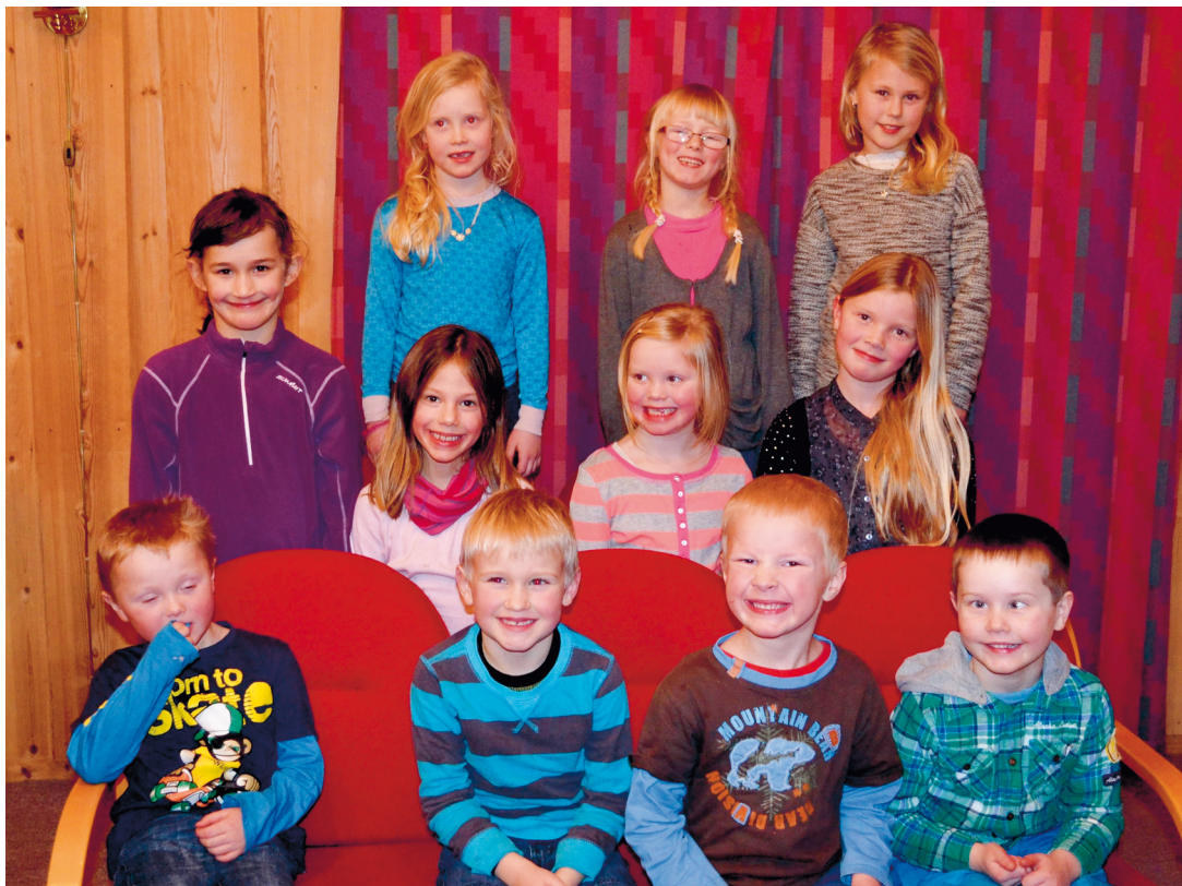
Kviteseid Barnegospel under øving på Misjonshuset 20.02.2014.