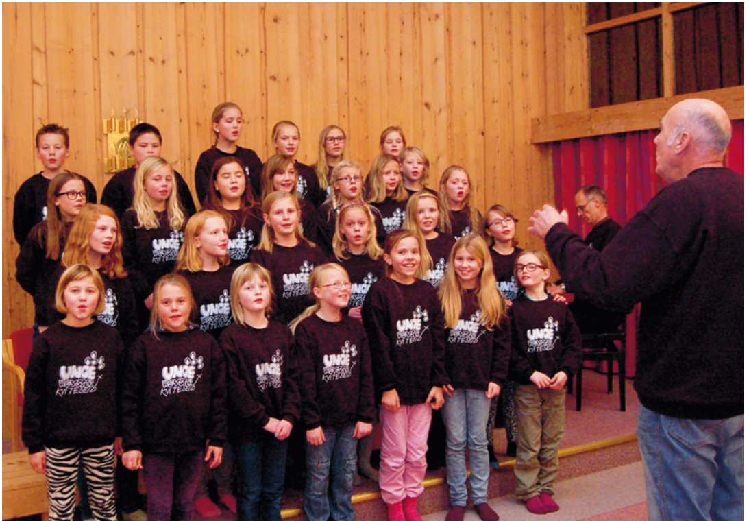
Unge Røyster under øving på Misjonshuset 25.11.2013.