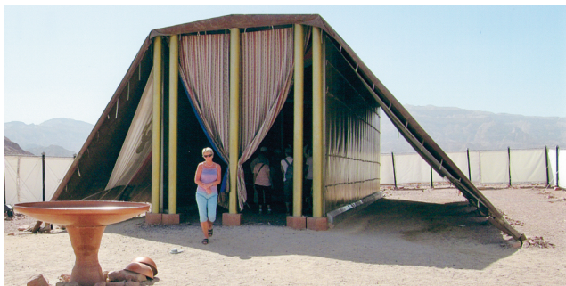
I Timna park, 25 km nord for Eilat, er det reist ein modell av det bibelske tabernaklet.