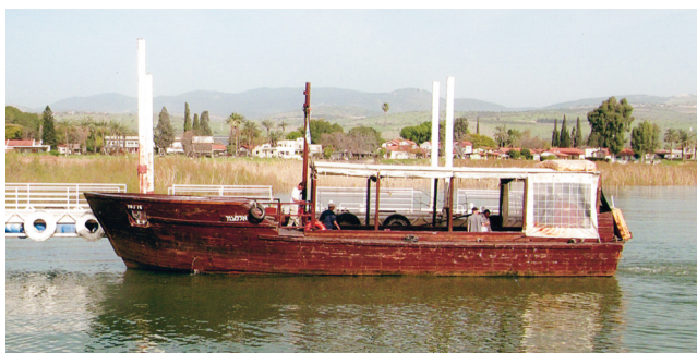
Båten vår på Genesaretsjøen ved Magdala. Sjøen gjev ferskvatn til store område av Israel. Jordanelva fører vatn frå friske kjelder ved Cæsarea Filippi og Hermonfjellet.

om gudsopenberringa, livet og lagnaden til jødefolket, profetane si oppgåva. Frå Det nye testamentet møtte me forteljingane om Jesu liv. Desse kunne vere kopla saman med bibelord og salmevers. Me fekk eit indre landskap for vår tru.