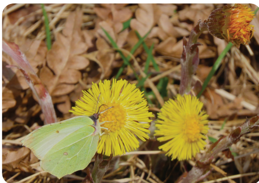
Sitronsommerfugl på Hestehov.

2.Påskedag: Vi avslutter påsken med kulturkveld på Olberg kirkestue kl. 18.00. Kjell Bjørka viser bildeserien «Påske på Patmos». Kaffe, kaker og loddsalg.