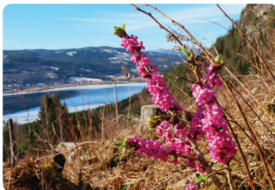
Tysbast, Greenslia.

Jeg gleder meg til å bli kjent både med barn og voksne i menigheten og håper at vi sammen kan skape gode opplevelser hvor vi lærer om og utforsker den kristne tro.