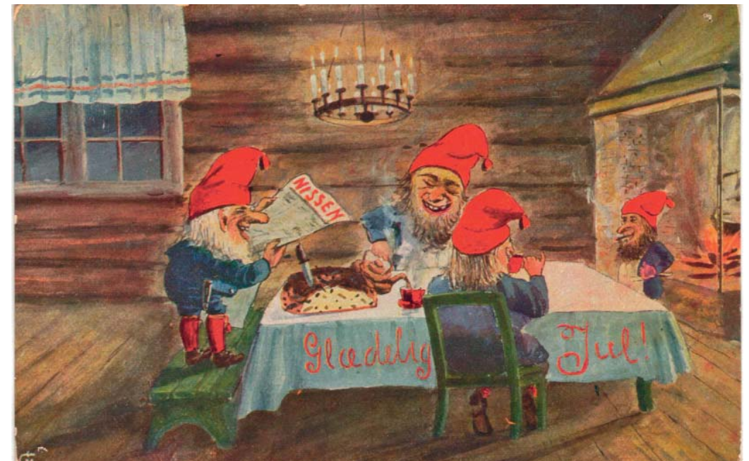
I sagnene opptrer nissen som oftest alene, og det var en vanlig oppfatning at de bodde alene. I enkelte fortellinger dukker en nissekone eller en nissefamilie opp. Felles for beretningene er fremstillingen av nissene som mannsfigur. Julekort fra Kystmuseet Hvalers samlinger, poststemplett i 1919.

Et karaktertrekk ved nissesagn er at de ofte skildrer episoder mellom nisser og dyr. Felles for flere av sagnene fra Hvaler er at de handler om nissen som stjeler «maten bort fra kyr han ikke likte og gav den til andre kyr han var glad i». Dette gikk særlig ut over en hest på Kjølholt: «På Kjølholdt hadde man en gang en hest som aldri kunde få kjøtt på bena. Den var så radmager at det var en ynke å se den. Det var selvfølgelig nissen som stjal maten fra den og gav den til andre dyr».