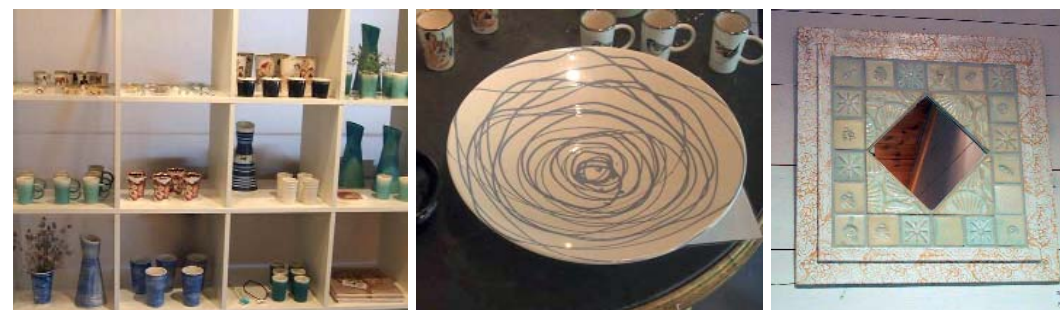
Vakker keramikk i topp kvalitet