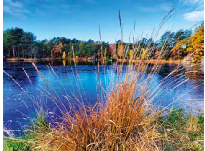
Baneheia med 3. stampe er et svært populært turmål enten du går fra Sentrum, Eg eller Grim.

Tilbake til turstier og badeplasser. Hvorfor heter disse tjernene 1. 2. og 3. Stampe? Det fortelles at i 1704 ble det anlagt en stampemølle inn under Baneheia. Denne ble brukt til bearbeiding av tøy, ull og skinn. Undertegnede har ikke sett noen eksemplarer av disse møllene, men kort fortalt fungerte det slik at et vannhjul driver en aksling, som så løfter flere stokker og som så slippes ned i et trau. Tekstilene blir da på en måte tovet og og mykgjort. En enda eldre metode for stamping var å bruke føttene, noe som var meget tungt arbeid. Men kanskje det var like god trim som joggeturer i Baneheia?.... Apropos navn mener man at Baneheia kommer av at det i sin tid var en reperbane i området hvor Nybyen ligger i dag. Dette var en «bane» hvor det ble laget tau og trosser.