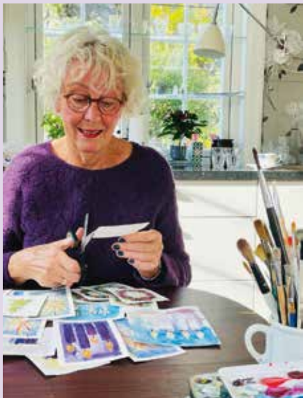
Gro Line maler sine egne julekort.