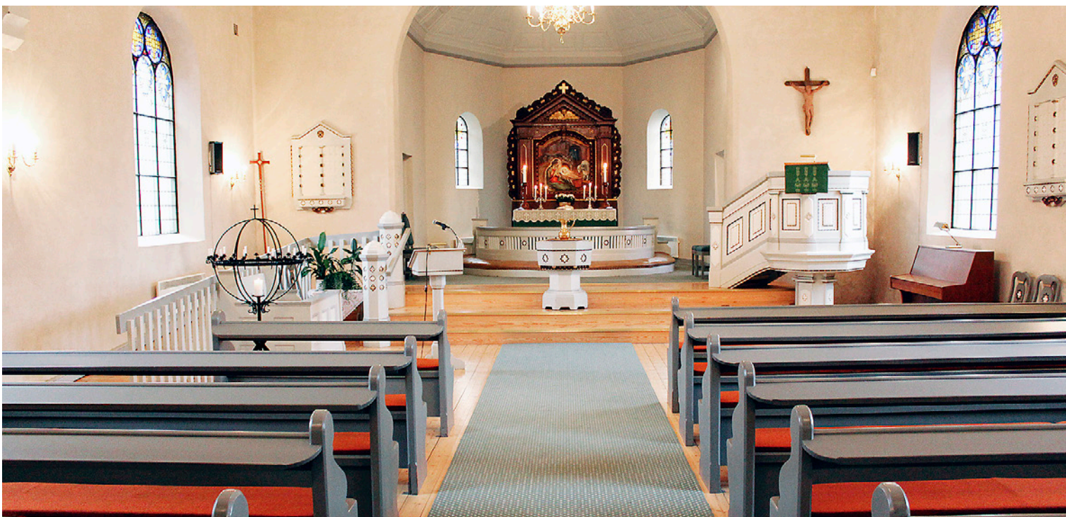
Tistedal kirke etter restaureringen i 2002.

Interiøret i Tistedal kirke skiller seg ut fra de andre kirkene i distriktet. Den har nemlig en altertavle som henter sitt motiv fra Jesu fødsel. Med denne altertavla forstår vi godt at noen kaller Tistedal kirke for «Julekirken».