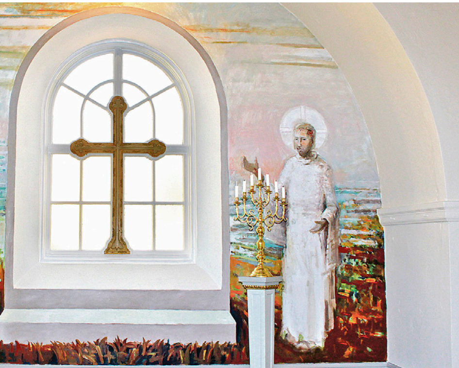
Fondveggen i Tistedal kapell. Malt av Ole Jakob Ihlebæk.