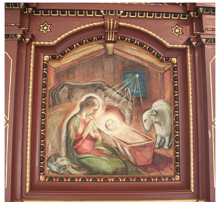
Altertavlen i Tistedal kirke.