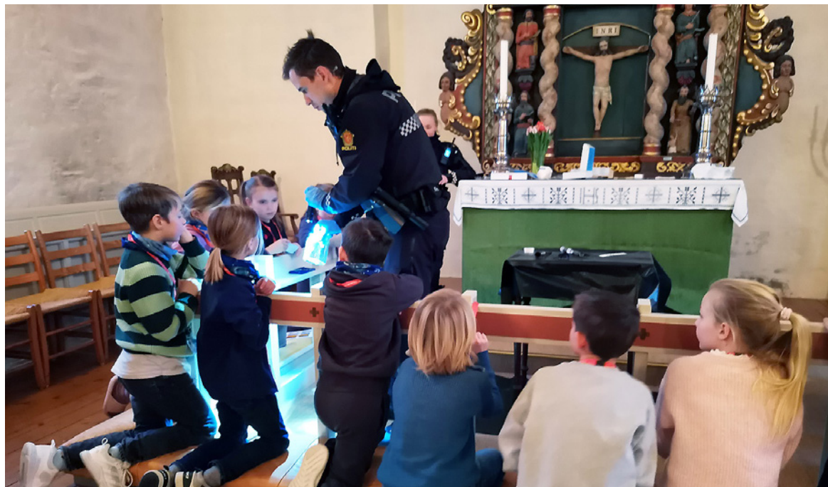
Politiet hadde med seg utstyr som viste hvordan man tar fingeravtrykk.