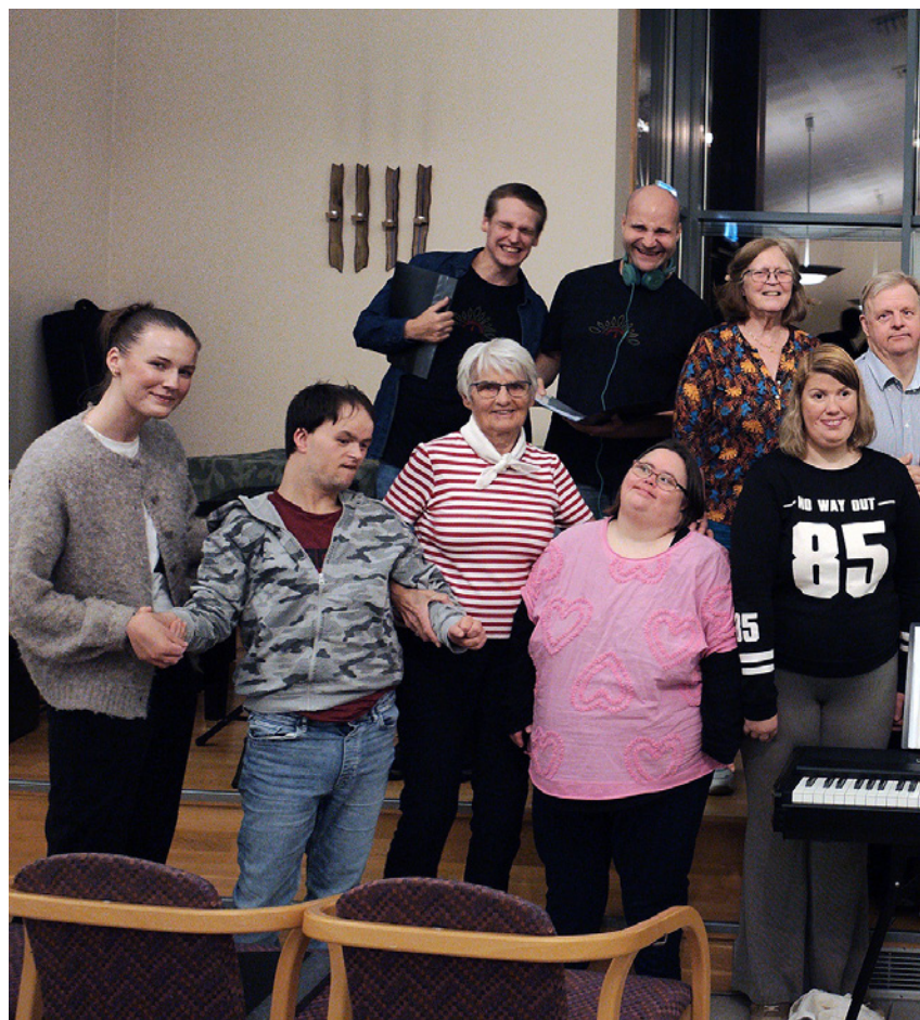
Denne gjengen gleder seg til flere konserter dette året. Gledessprederne har sine faste øvelser i Normisjonshuset på Glenne.

Diakonen sitter i Tverrfaglig team ved lindrende enhet på Helsehuset. Dette er et team som består av lege, sykepleier, ergoterapeut, fysioterapeut, kreftkoordinator og diakon. Igjennom dette medfører det samtaler med pasienter og pårørende ved behov. Prestene er nærværende med andakter og besøk/samtaler på alle aldersinstitusjoner her Halden.