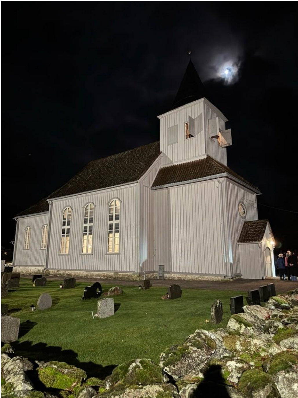
Prestebakke kirke november 2025