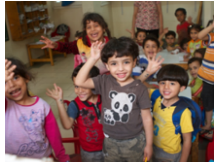
Stefanusbarna gir slumbarn et stødig plattform i livet.

Misjonsengasjement handler om mye mer enn å gi kollekt. I begge menighetene er man opptatt av at det særlig skal være en aktiv del av opplæringsarbeidet blant barn og unge.