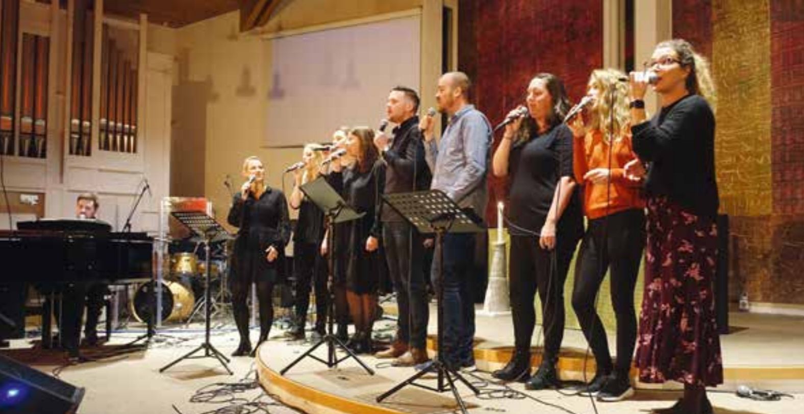
Et gospelkor, improvisert for anledningen, bidro med frisk sang.