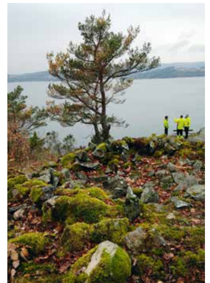
Denne steinrøysa var en varde helt fram til 1960-tallet.