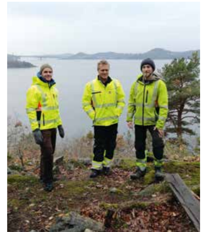
Det er ryddet på flere utsiktspunkter på heia bak Ansgarskolen. Her vil det også bli satt opp nye benker.

Kristiansand.kommune.no lokalhistoriewiki.no Frans-Arne Stylegar: Ødekirker og kirkesagn (artikkel 2004).