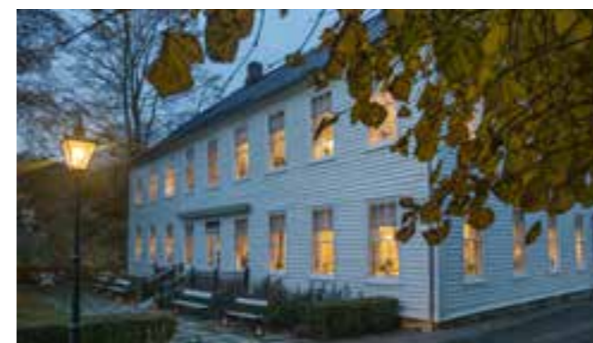
Boen gård tar seg flott ut en sen høstkveld i oktober.

En vakker høstkveld i oktober var over 80 middagsgjester samlet til «Venn til venners-fest» på Boen gård. Gjennom gjestenes økonomiske bidrag kan nå planene om nytt lysanlegg ved Tveit kirke realiseres.