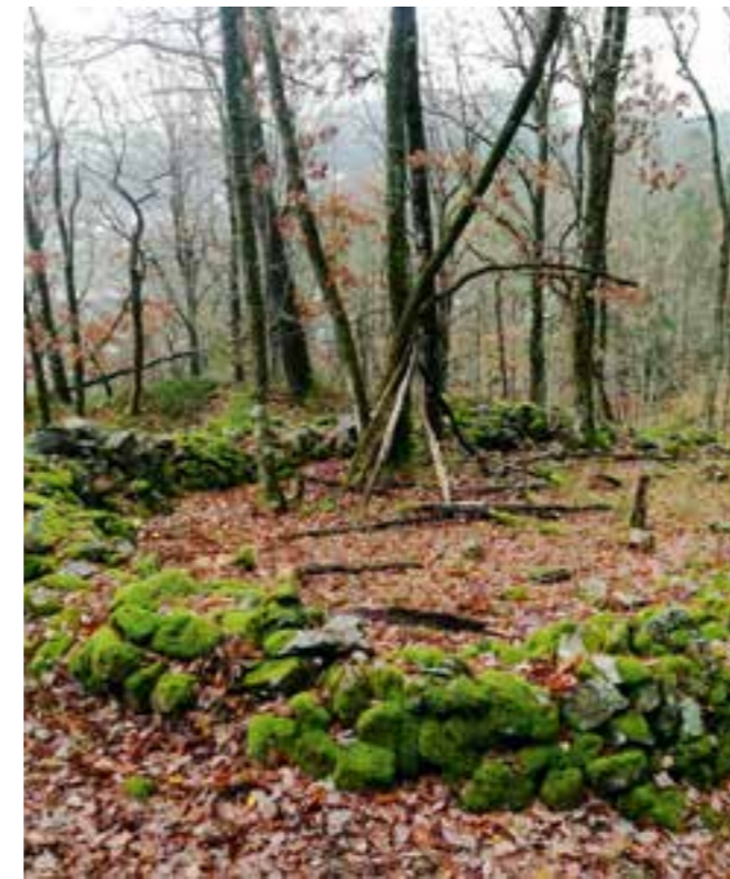
Den såkalte kirkegården der sjøfolk kan ha blitt gravlagt i senmiddelalderen.

Seilskutene kom inn Topdalsfjorden der tømmeret var samlet i området mellom Grovika og Hamresanden etter å ha blitt fløtt ned Topdalselva. Særlig mye tømmer ble eksportert til Nederland. Denne tømmervirksomheten var