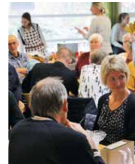
Fullt hus i seks timer.