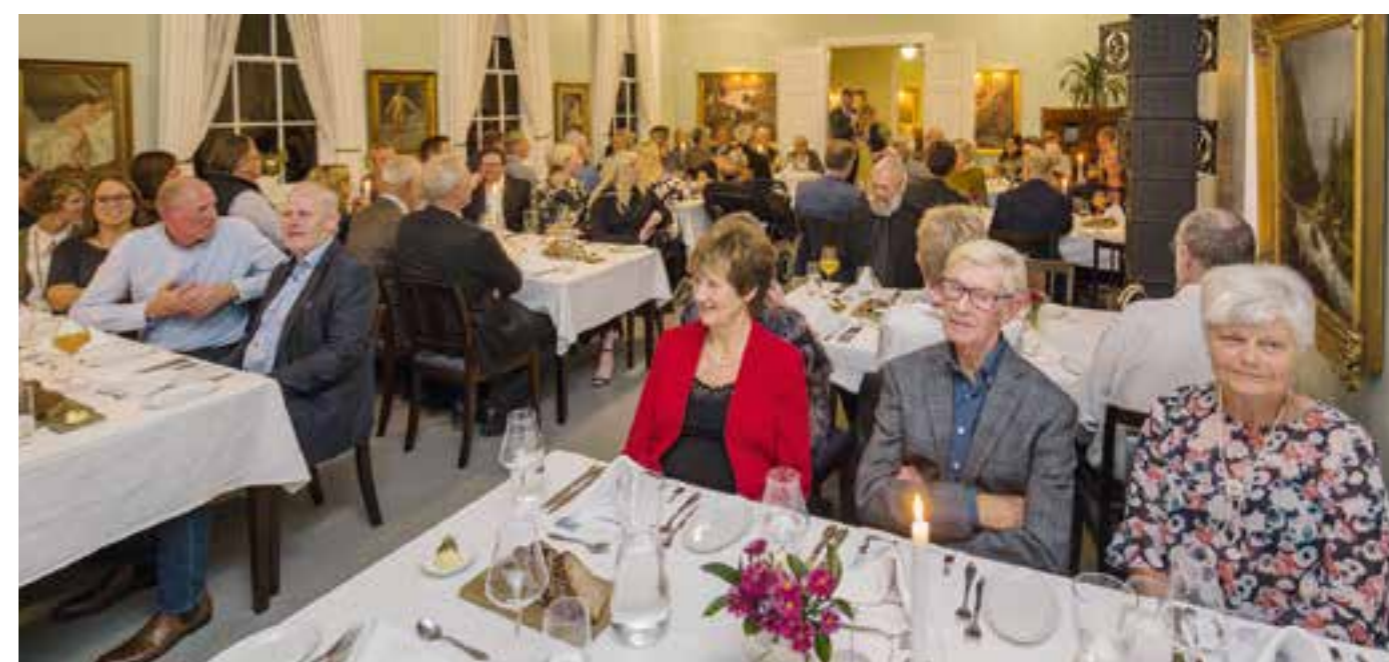
Over 80 gjester var samlet lørdag 13. oktober på Boen gård og sørget for at det kom inn mer enn 90.000 kroner til nytt lysanlegg ved Tveit kirke.