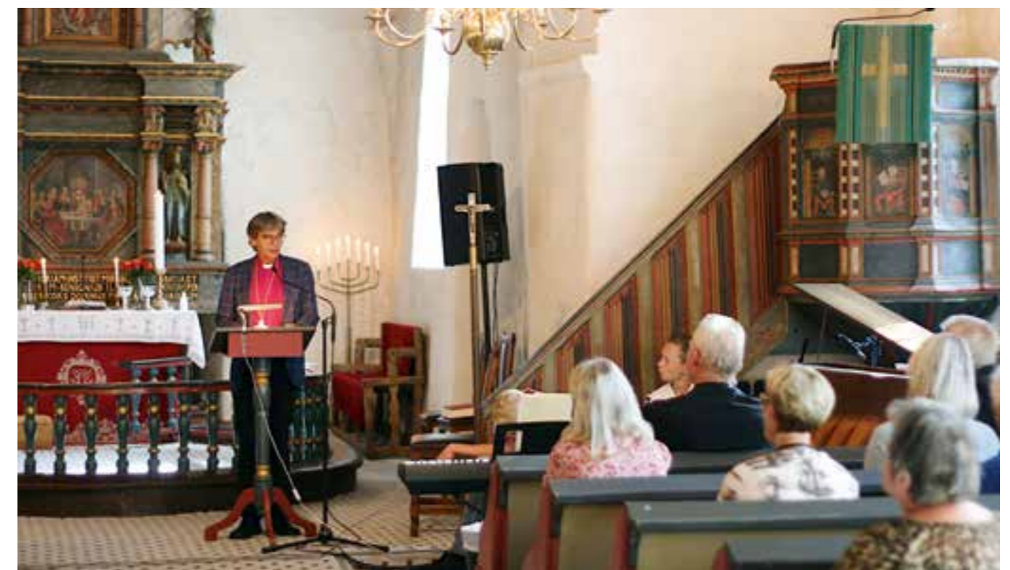
Biskopen gav menighetene noen utfordringer i sitt visitasforedrag.