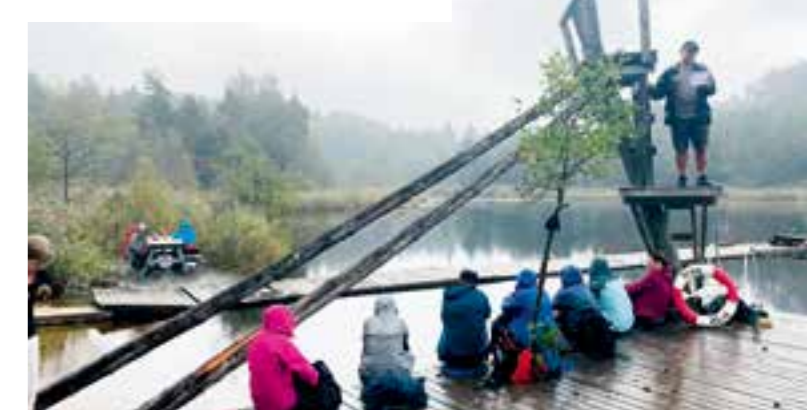
Velfortjent hvil for den aller siste etappen mot Tveit kirke.

Hellig e stien i den store skogen Hellig e sporå bak den svarte ploegen Hellig e den jorda du går på og det språk ditt hjerta slår på