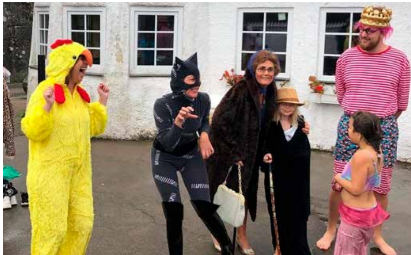
Det varmes opp til kostymebad.