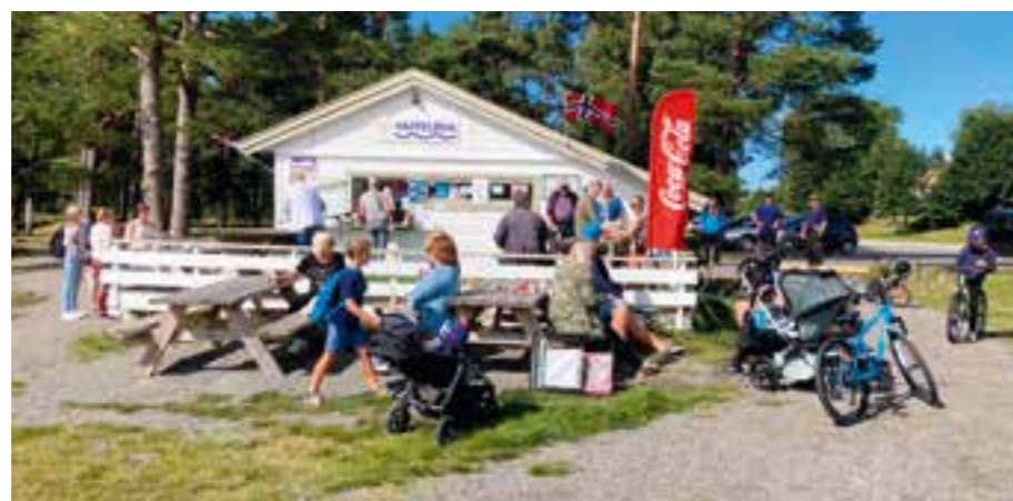
På en godværssøndag selges vafler, is og kaffe for om lag 8000 kroner fra denne kiosken.