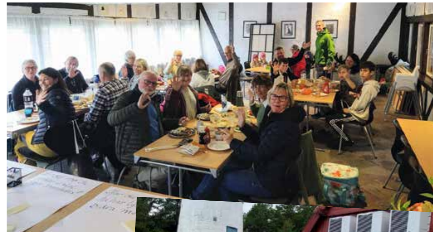
Over: God stemning under måltidet.

Så var det tid for å lytte og se fremover. Det ble lagt frem fire tomme store ark, med overskriftene: Hva synes du er bra med Hånes menighet? Hva tenker du Hånes menighet kan bli bedre på? Hva drømmer du om for Hånes menighet?