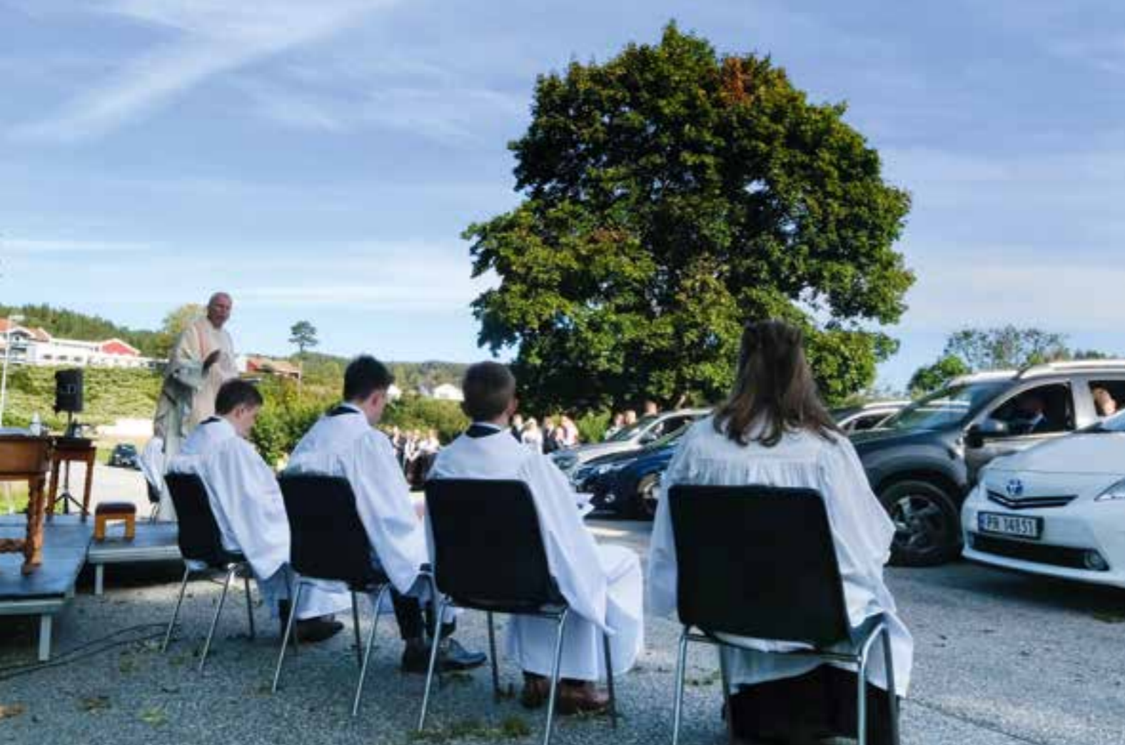
Utekatedralen kunne ikke vært vakrere da historiens første drive-in konfirmasjon ble arrangert i Tveit.