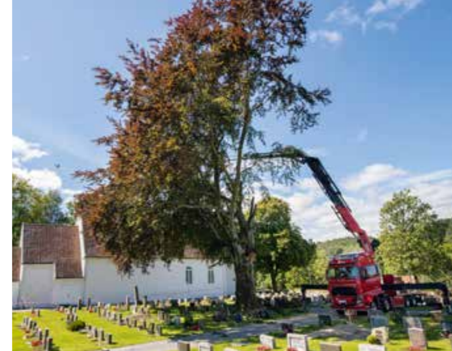
Til venstre: Den majestetiske blodbøken er nå erstattet med en stor himmelhvelving