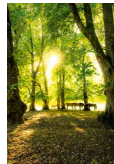
Hester på Boen gård.