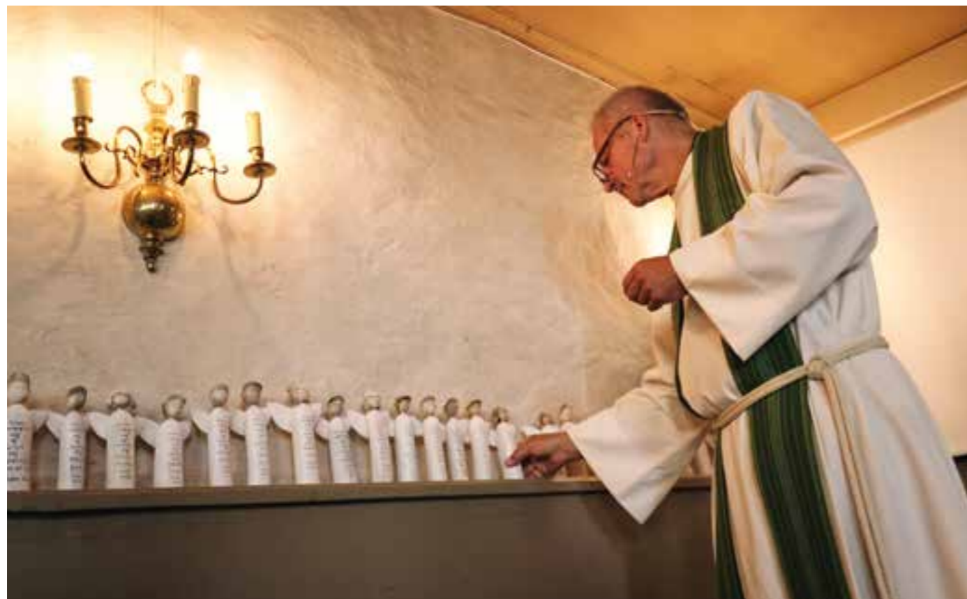
Hele 35 dåpsengler har stått på rekke og rad dette siste året.