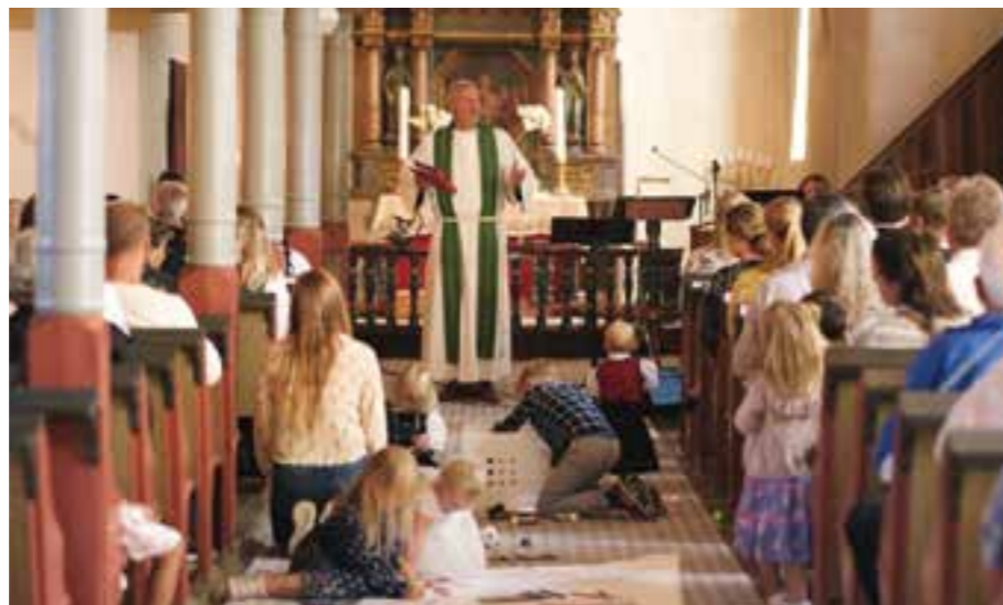
Jo mer liv og røre under englesøndagen, dess bedre.