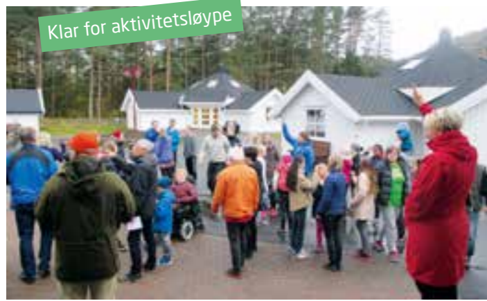
Klar for aktivitetssløype