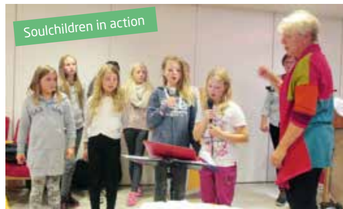
Soulchildren in action

Forespørsel om kirkelige handlinger som dåp, vigselse, gravferd, inn/utmelding og annet, vennligst kontakt: