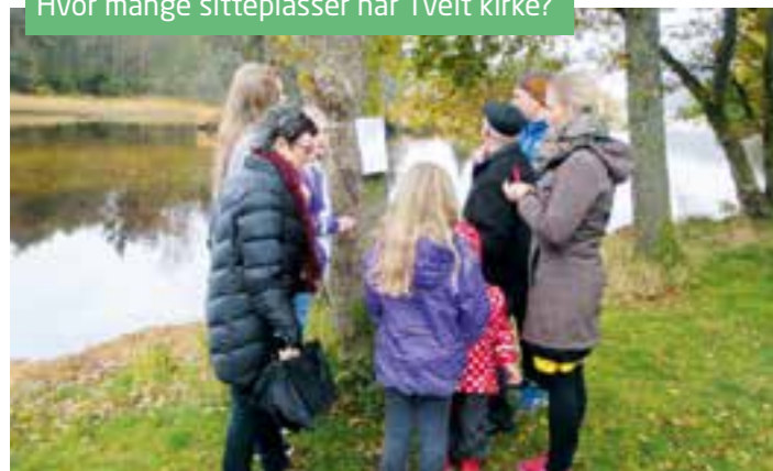
Hvor mange sitteplasser har Tveit kirke?