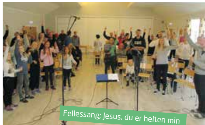
Fellessang: Jesus, du er helten min