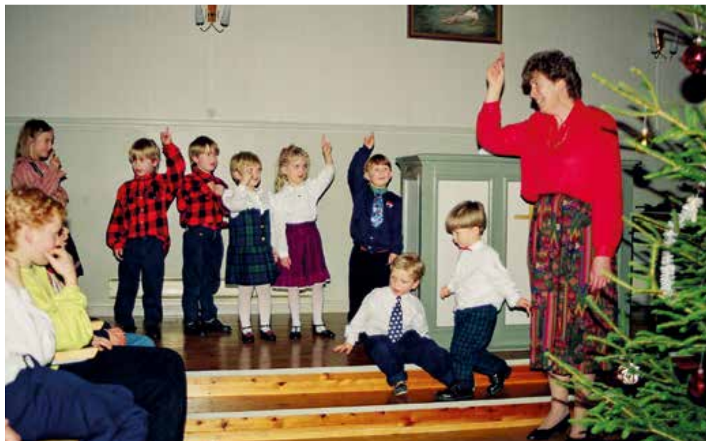
Det går fortsatt gjetord om søndagsskolens juletefester på Ve bedehus. Dette bildet er fra 1992.