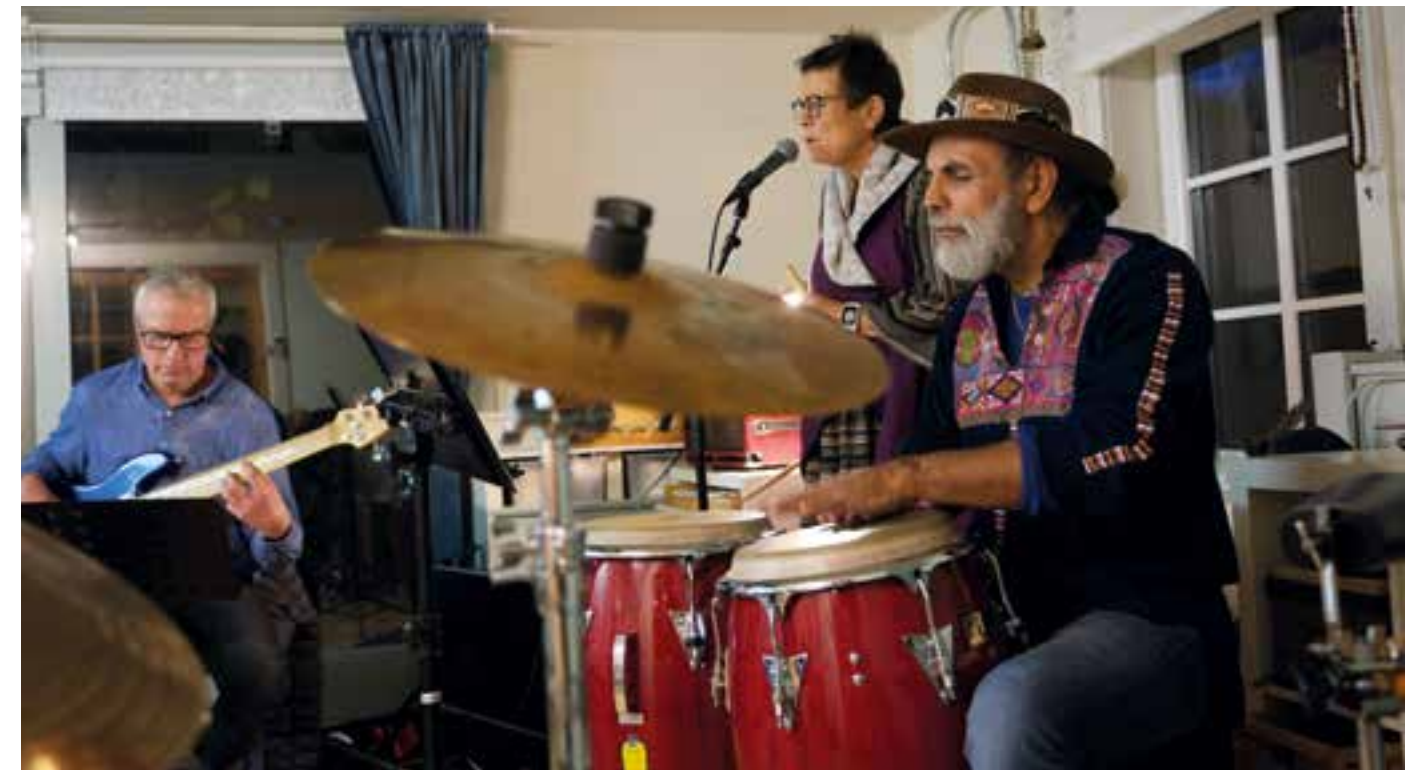
Magi på Drangsholt. Den herlige kraften som ligger i hvordan musikk finner sin vei gjennom tid og rom.