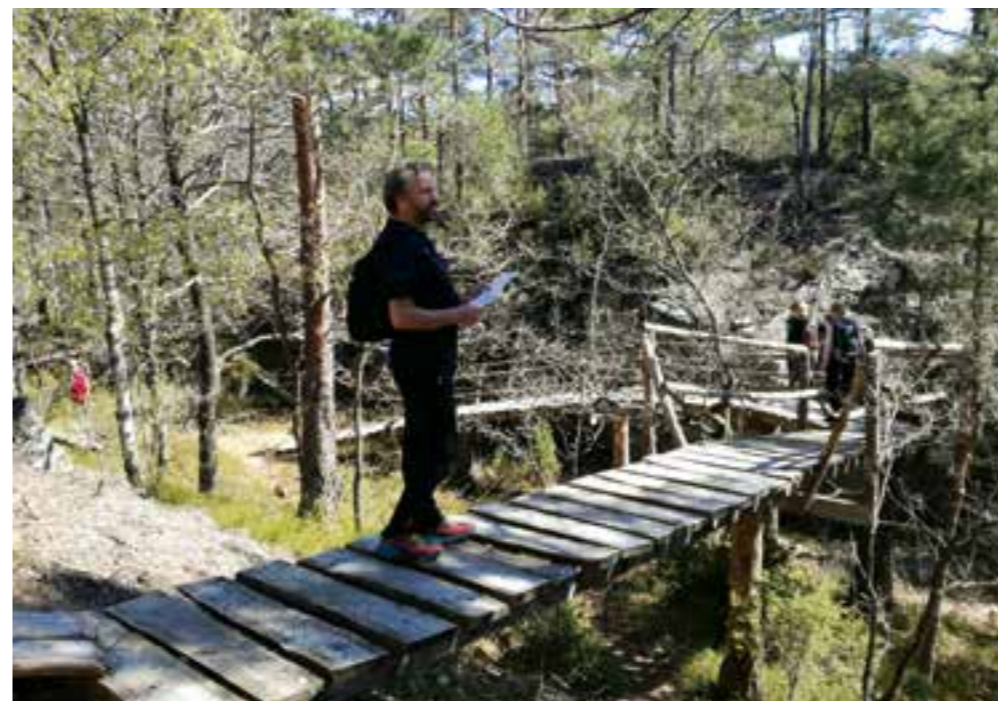
På en flott hengebru for gående og syklist i skogen øst for Dønnestad der skogens egne materialer er brukt.

jordnære. Furusus er balsam for ørene, mens fly-dur virker forstyrrende. Lyden av rennende vann gir en helt annen ro i sinnet en drønet fra den endeløse strømmen av biler på veg fra A til B.