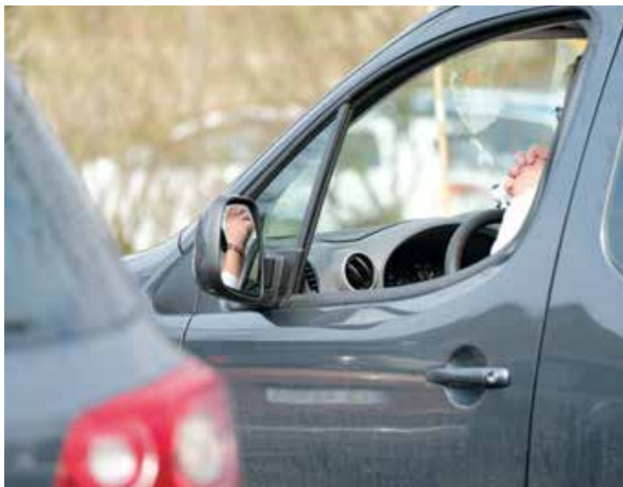
Ytre forhold forandrer seg, men de grunnleggende menneskelige behovene for ro og trygghet er de samme.

Han kom på idéen etter at han hørte om en drive-in kveldssamling som ble arrangert i Skien, og så også et tv-innslag om drive-in kino. Den gode parkeringsplassen utenfor kirken i Tveit burde kunne egne seg til noe tilsvarende. Staben ble med på forsøket, og i løpet av våren er det blitt