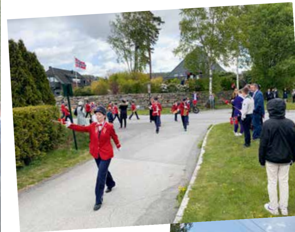
På Hånes gikk skolekorpset gjennom bydelen før de holdt en liten konsert ved Hånes Panorama.