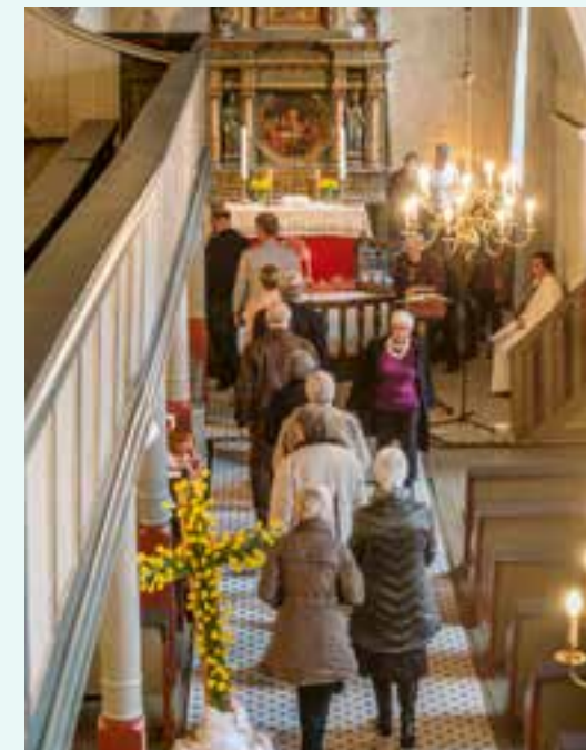
Påskefeiring i Tveit kirke

Påskefeiring med påskelilje-kors i Tveit kirke.