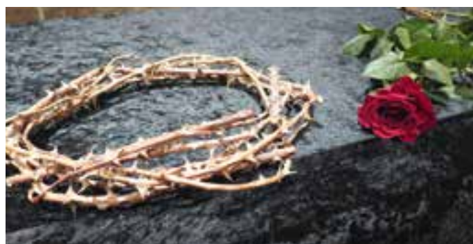
Alteret ble dekket med sorgens farge i form av sort fløyel, og røde roser ble lagt på.