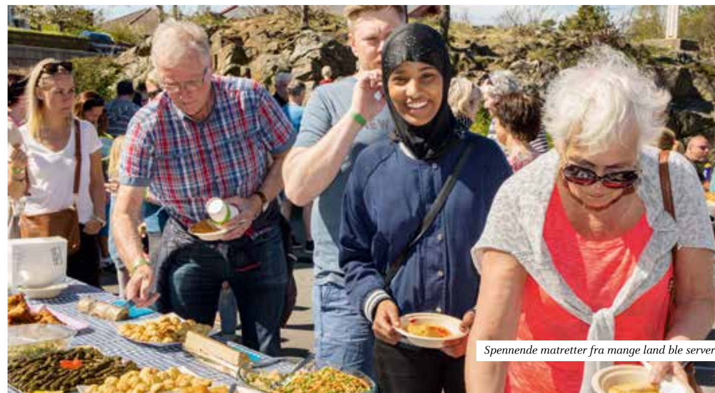
Spennende matretter fra mange land ble servert.