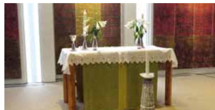
Første påskedag var det sorte erstattet av hvit duk og livskraftige hvite liljer, et symbol på oppstandelsen.