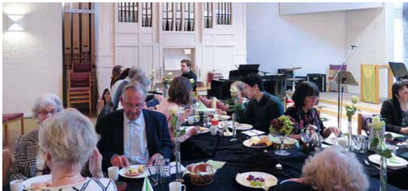
Kirken ble ryddet for å gi plass til spisebord formet som et kors.