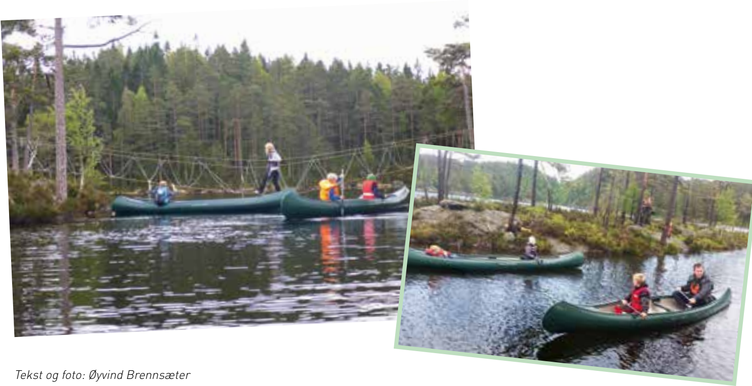
Tekst og foto: Øyvind Brennsæter

Gjennom aktiviteter ute i naturen og formidling av kunnskap ønsker speiderledere i Tveit å gi barna grønne verdier og holdninger.