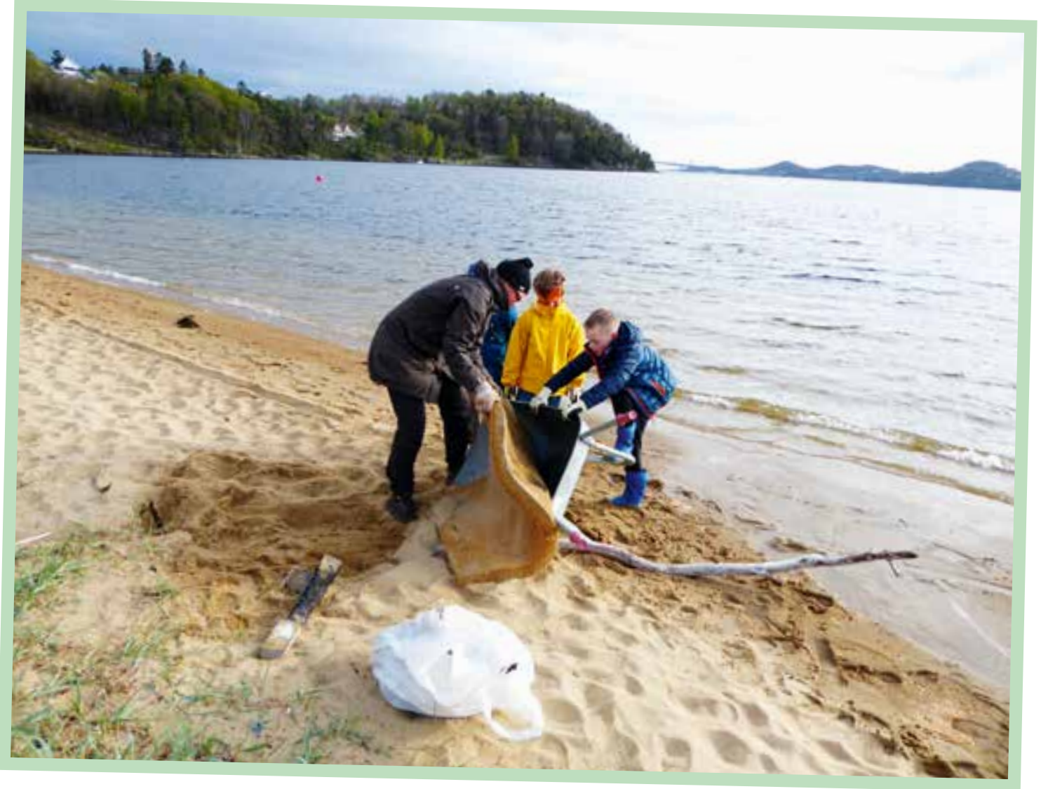
Tveit-speiderne deltok også i år under Strandryddedagen på Hamresanden.

- Mange av oss som er ledere i dag, har selv vært speidere siden vi var barn. For å holde aktiviteten i gang trenger vi flere ledere. Hvis det der ute som kan tenke seg å være med å drive et positivt arbeid for bygdas barn og unge, er det bare å ta kontakt, avslutter ledertrioen.