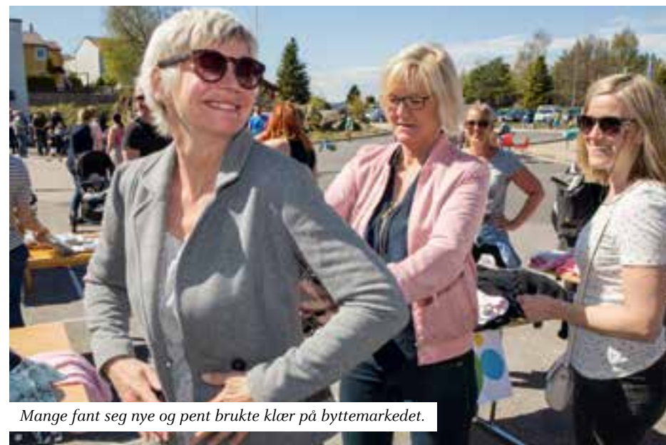
Mange fant seg nye og pent brukte klær på byttemarkedet.