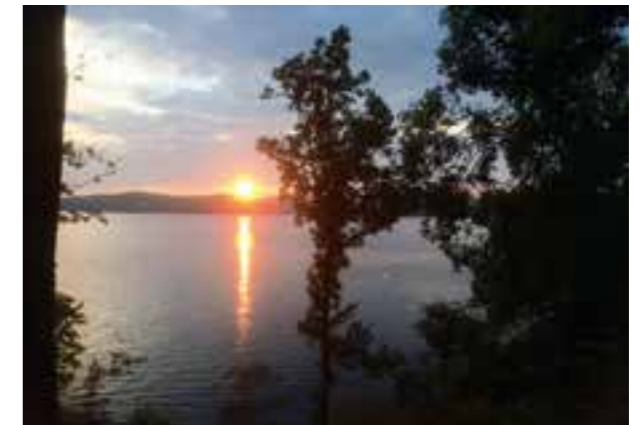
Fra Solvika på Hånes.

Gud er Skaperen med stor S, kilden til alt liv. Gud skapte vår verden helt fantastisk ned i hver eneste minste mikropartikkel, og hver eneste dag ser vi hvordan Gud fortsetter å skape, hvordan han fortsetter å holde skaperverket i blomstrende, boblende og levende. Det finnes mirakler omkring oss som vi ikke engang tenker på, for eksempel solen som varmer oss på nytt hver morgen, hestehoven som spretter opp av snøen hver vår, føllet som tar sine første vaklende skritt.. Alt dette og uendelig mye mer