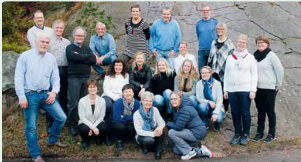
Hånes og Tveit kirkekor i jubileumsåret.