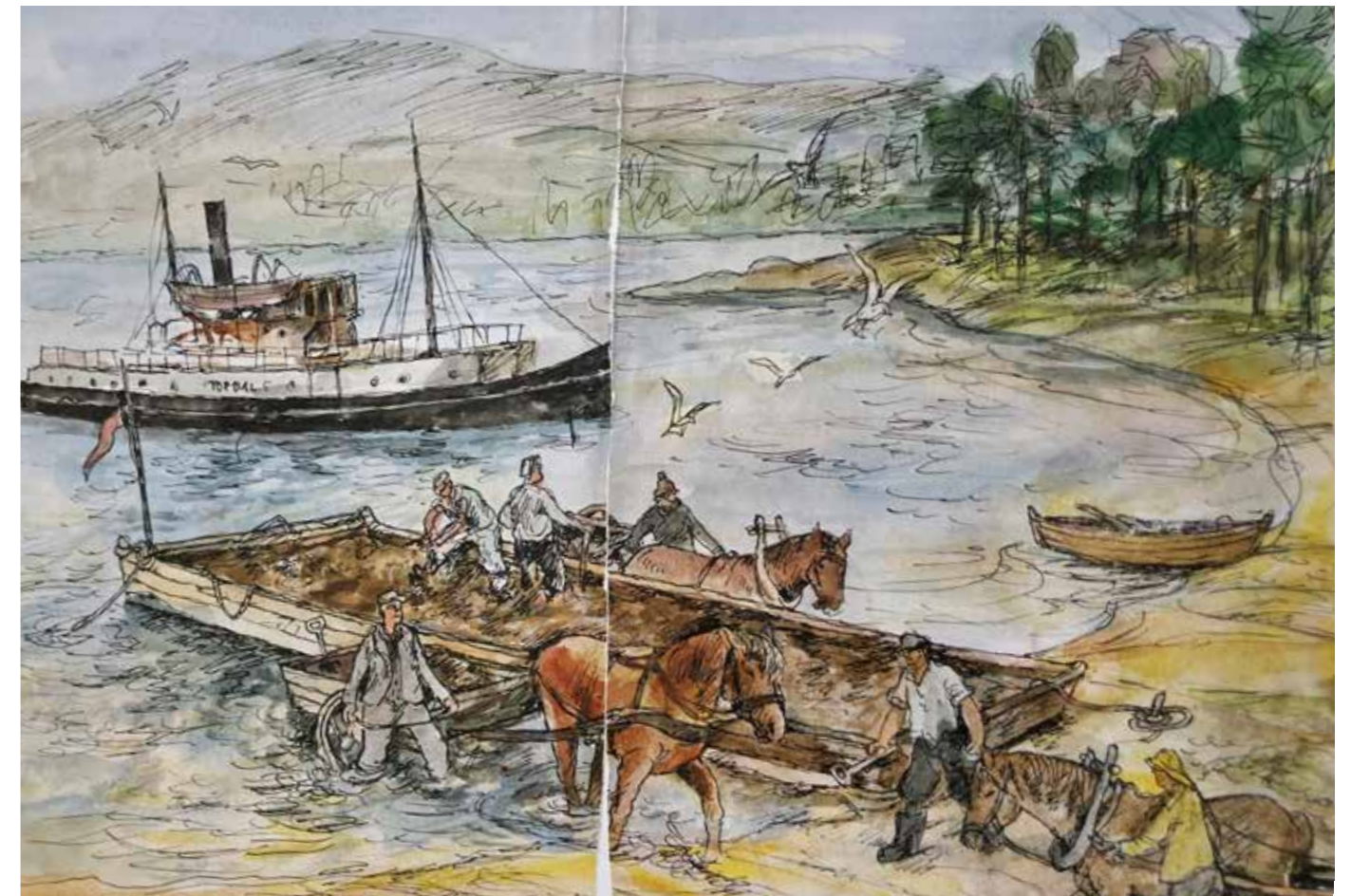
Dampbåten Topdal var i mange år et kjent syn på elva gjennom Tveit.