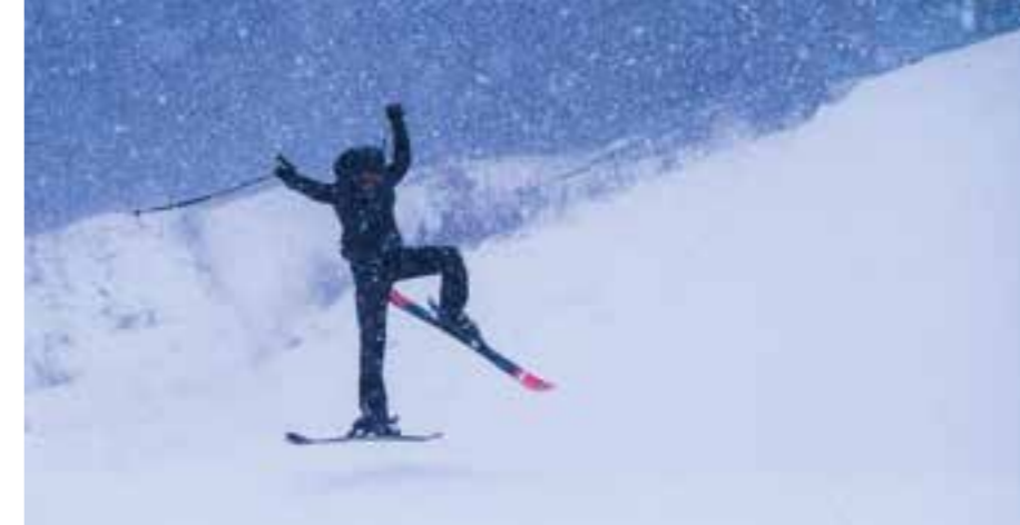
Gledesutbrudd fra en skientusiast.

Når kanonene er satt på og sprøyter ut snø, må de sjekkes døgnet rundt. Da går dugnadsgjengen turnus. Inspeksjon midt på natten er kanskje ikke den mest ettertraktede vekten, men til gjengjeld får man frisk luft,