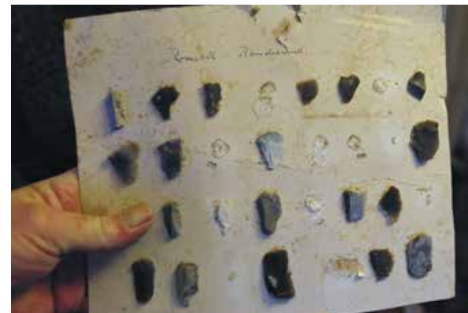
Flintgjenstandene stammer fra Raustøl i Randesund.