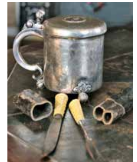
Alterkalken i sølv stammer fra Arendal og ble i sin tid kjøpt av en omstreifer. Kniven, med dobbel slire, har opphav i Setesdal.