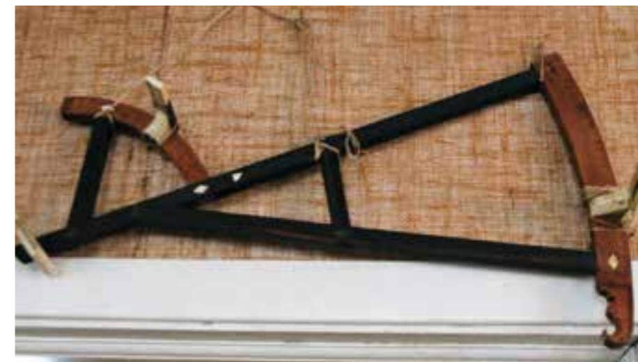
Dette er en oktant, et geometrisk måleinstrument som ble brukt til navigasjon.