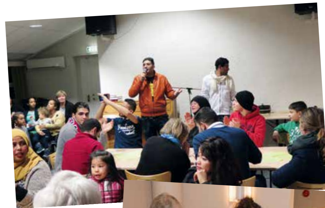
God stemning, internasjonal mat og arabisk sang under samlingen i Hånes kirke.

Vi møter de to eritreerne på Hamresanden menighetshus der ulike lag og enkeltpersoner hver tirsdag formiddag siden nyttår har hatt åpnet hus for flyktingene og alle andre som ønsker å komme.