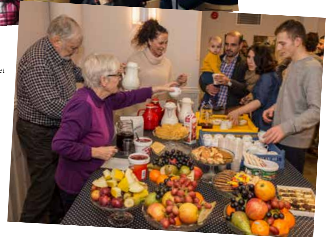
I vinter har frivillige i Tveit menighet stilt opp for flyktingene som har hatt midlertidig opphold på Hamresanden.

Dagen etter treffer vi dem igjen, denne gangen i Hånes kirke på internasjonal aften, der over hundre mennesker er samlet til internasjonal mat og sang på flere tungemål.