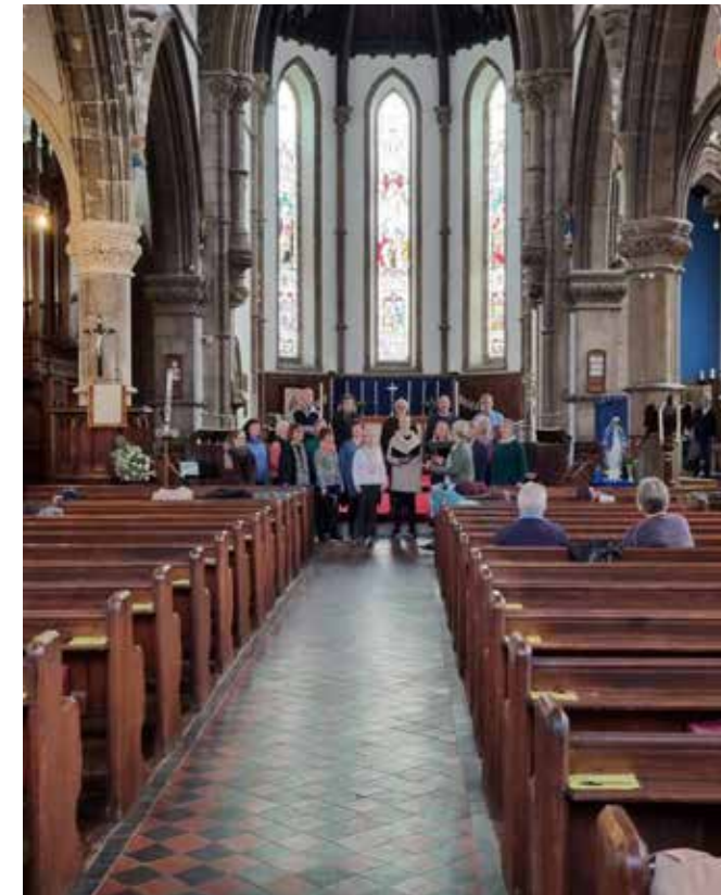
York er kjent for sine mange storslagne kriker, ikke minst York Minster.

Jeg ble løftet og hadde egentlig dårlig bakkekontakt under resten av turen. I mitt indre runget toner og tekster.