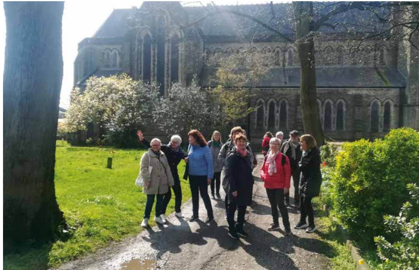
Kormedlemmer fra Hånes og Tveit utenfor St Lawrence kirken i York.

Koret hadde pratet om dette lenge: Det hadde jo vært hyggelig å dra på tur sammen. Vi har et bra sosialt sammenhold, korets medlemmer er alle sammen våre venner. En tidligere tur, inkludert overnatting, gikk til Iveland. Hva med noe litt lenger bort – hva med York?