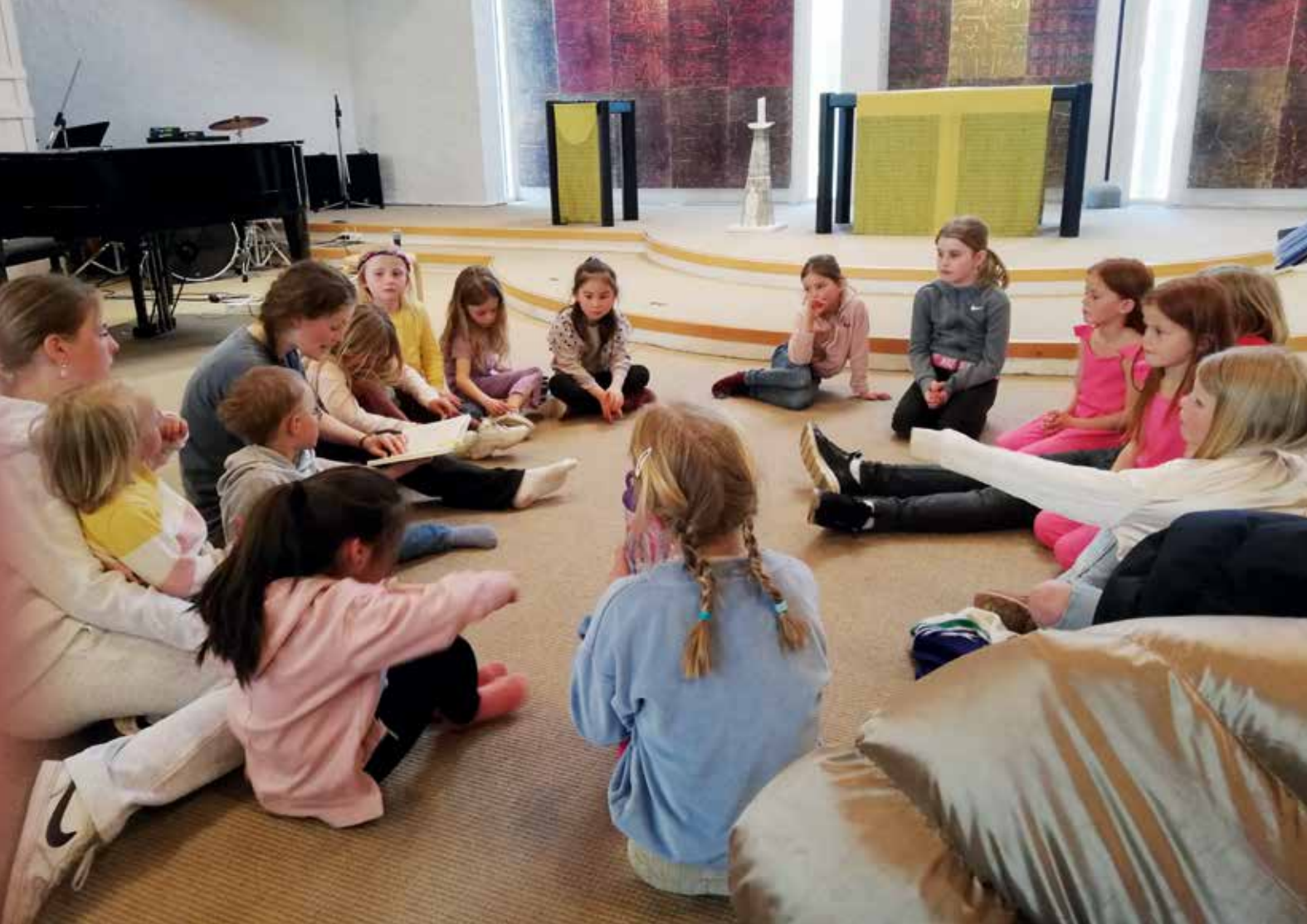
Etter sangøvelsen er det lesestund med barneboka «Camilla og tyven».