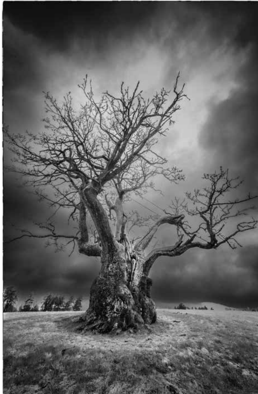
Mollestageika er kjent motiv i nærområdet, men som alltid kan by på nye fotomuligheter.

Han blir aldri ferdig med et motiv. Det kan alltid fremstå på en ny måte gitt andre lysforhold. De beste mulighetene kommer tidlig om morgenen, når lyset begynner å bryte gjennom tåken. Da blir det mer enn bare et bilde. Et favorittmotiv i nærområdet er alléene på Boen gård. - Når jeg fotograferer et gammelt tre, kjenner jeg på en spesiell ærbødighet og på evigheten.