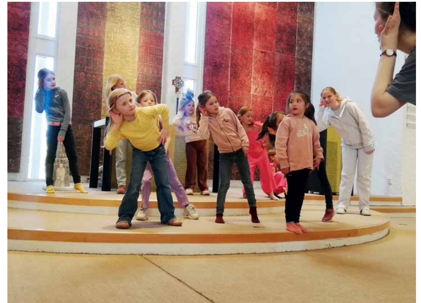
Energi og engasjement preger øvelsene til barnekoret i Hånes kirke.