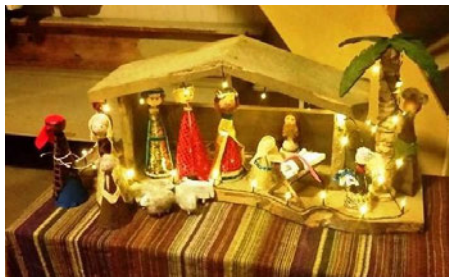
Arkivfoto av julekrubbe, Mjømna kyrkje