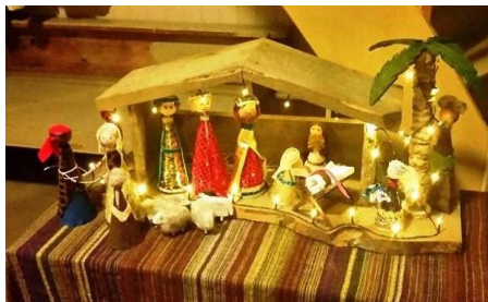
Arkivfoto av julekrubbe, Mjømna kyrkje