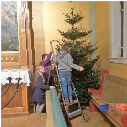
Arkivfoto frå juletrepyntinga i Mjømna kyrkje eit tidlegare år.

Vi ønsker alle velkommen til uhyggjeteleg juletrepynting i Mjømna kyrkje 21. desember kl. 17.00! Juletrepynten i Mjømna kyrkje er slitt og treng å fornyast. I den forbindelse inviterer sokneutvalet til «julepyntdugnad».