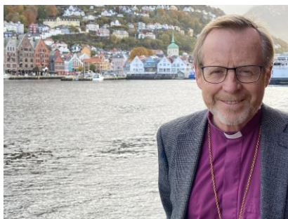
Biskop Halvor Nordhaug.