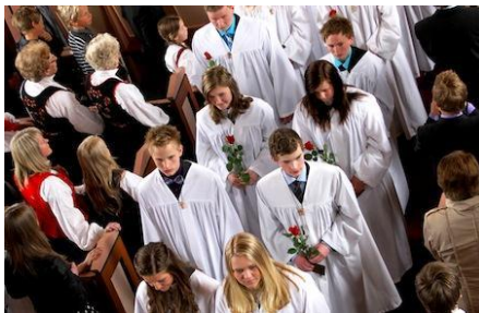
Arkivfoto frå ein tidlegare konfirmasjon

ledes år enn vi hadde tenkt, mye ble stengt ned, og både leir og enkelte gudstjenester ble avlyst. MEN.. dere har vært ærlig gjennom hele året og vist meg noe av hvem dere er, og det er jeg så takknemlig for.