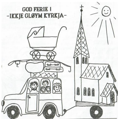
(Teikning: Marit Sandal)