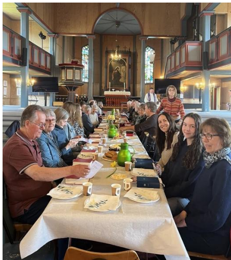
Skjærtorsdagsmåltid i Gulen kyrkje.

Summane inneheld kontantar og Vipps, og Vipps aukar kvart år.