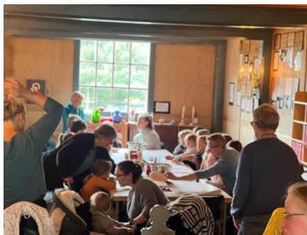
Laurdagsgraut i Gulen kyrkje

Born og unge er framleis eit viktig satsingsområde, og det gleder meg å sjå at laurdagsgraut, kyrkjeklubb og mykje anna samlar dei unge.