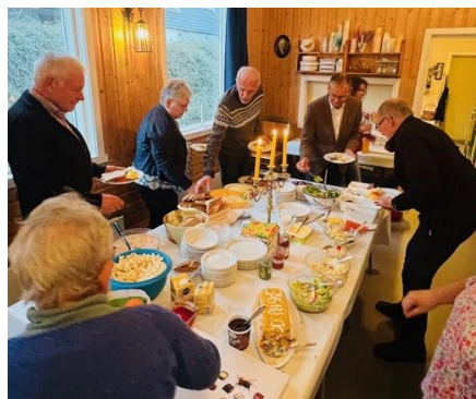
Påskekvelds på Brekke bedehus.

Sokneutvalet har delteke på adventsverkstad.