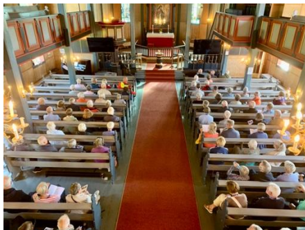
Frå pilegrimsgudstenesta juli 2025.

Gulen kyrkje ligg på ein av dei viktige nøkkelstadane langs Kystpilegrimsleia. Dette ønskjer vi å løfte fram i tida som kjem, og inviterer fleire til å oppdage både historia og vandringar langs leia.