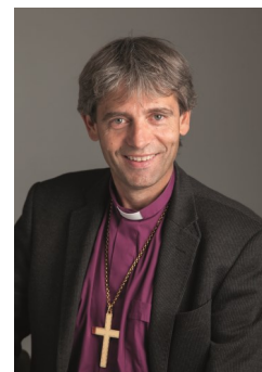
Stein Reinertsen Biskop i Agder og Telemark