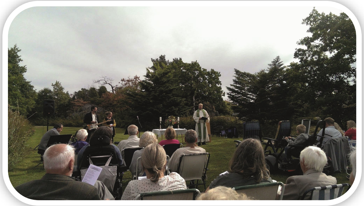
Friluftsgudstjeneste på Støle 19.august 2018