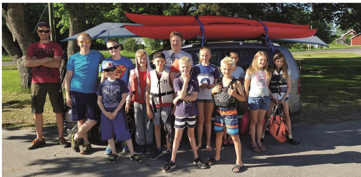
Klar for kano- og kajakkur i Syndle. Barn, foreldre og ledere.