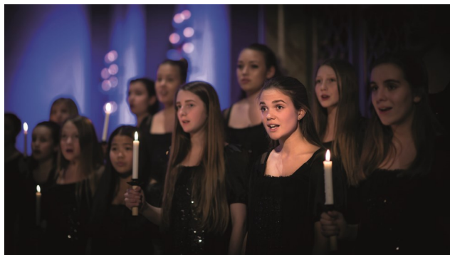
Det Norske Jentekor