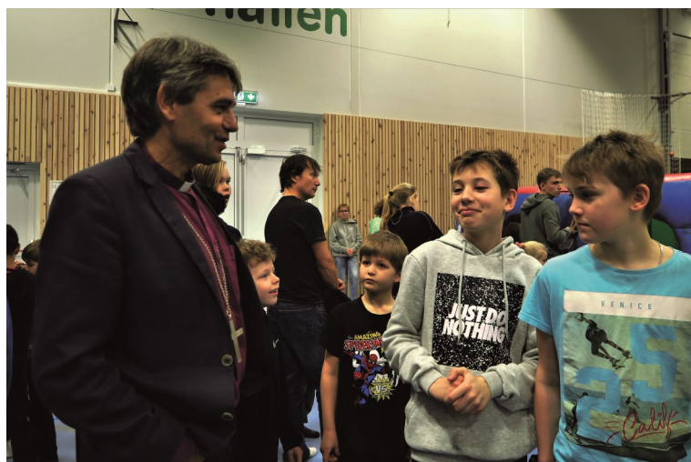
Biskopen tok seg god tid til en prat med de mange i hallen

Gjennomgangstema var FRIVILLIGHET. I sin korte appell tok biskopen utgangspunkt i frivilligheten og i ordet amatør. 'Amatør' kommer av fransk og betyr «en som elsker» og betegner en person som gjør noe fordi en liker – eller elsker – å gjøre det. Dette til forskjell fra en profesjonell. Både menigheter og samfunnet i sin helhet er avhengig av glade amatører – slik som en finner mange av i både Eide og Landvik.