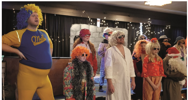
Besøk av «Farsund jorubics-klubb»