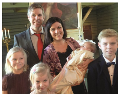
Hermine Andreassen Land