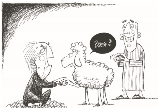
Jakobs aller første forsøk på å lure sin far mislyktes