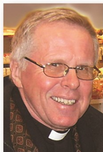
Øyeblikket er det eneste vi eier. Og evigheten.

Vi blir rikere av å innse dette og la det sette seg på kropp og sjel.