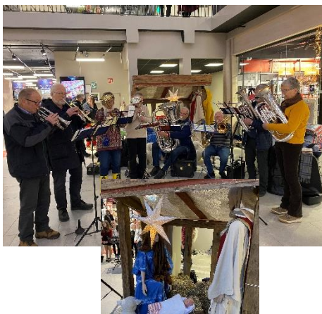
Messinggruppa «Glede» spilte, og «familien» lyttet også denne lørdagen