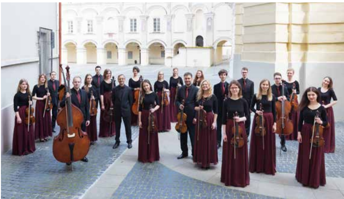
KAMMERORKESTER DELTAR: Hører til universitetet i Vilnius.

► MANDAG 18. juni blir det en sjelden musikkbegivenhet i Grimstad kirke. Da kommer et kor fra to kirker i Vilnius og skal synges sammen med Kristiansand Operakor og Agder Vokalsemble. Dessuten medvirker et kammerorkester fra universitetet i Vilnius.